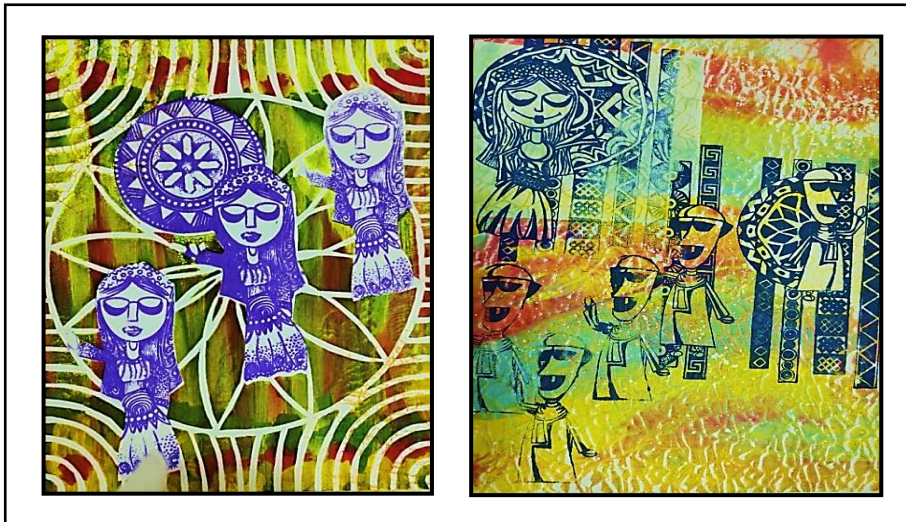
شكل رقم (٩)