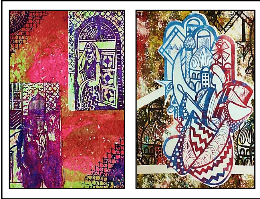
شكل رقم (٨)