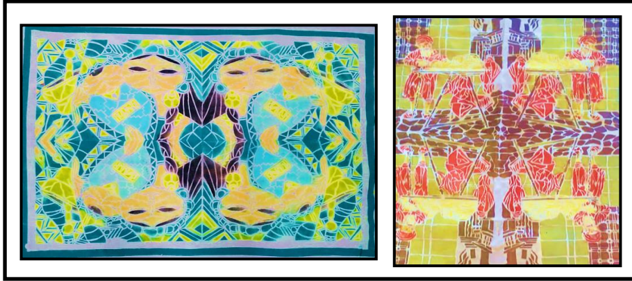
شكل رقم (٤)

عرض وتحليل لبعض الأعمال التجريبية التي نفذها الطلاب بأسلوب الاستنسل والشاشة الحريرية: