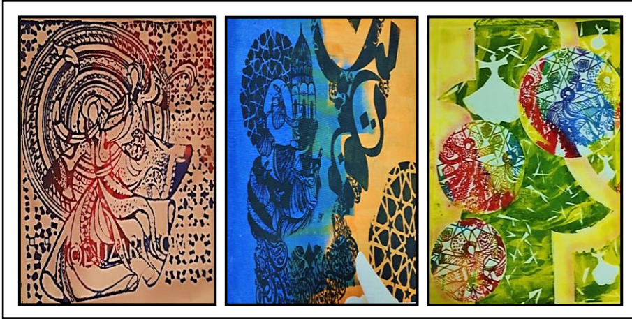
شكل رقم (٩)