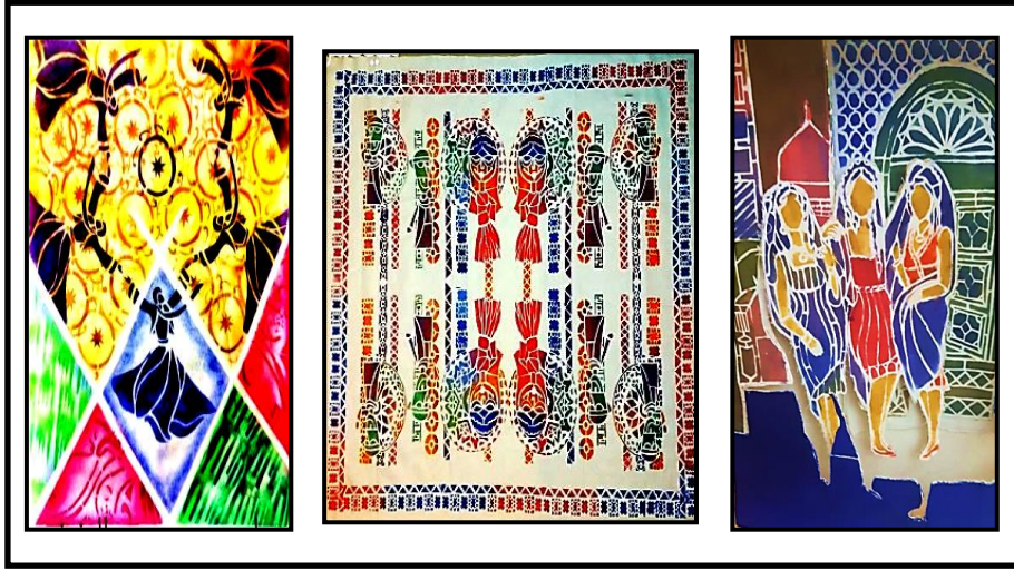
شكل رقم (٦)