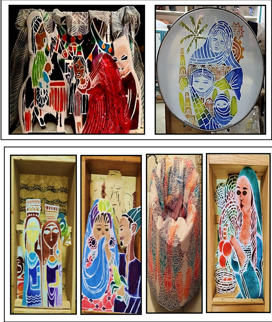
شكل رقم (١٠)

بعض المنتجات الجمالية والنفعية التي نفذها الطلاب بأسلوب الاستنسل وأسلوب الشاشة الحريرية (المصورة والمفتوحة):