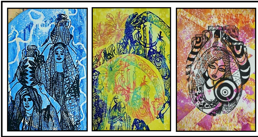
شكل رقم (٧)