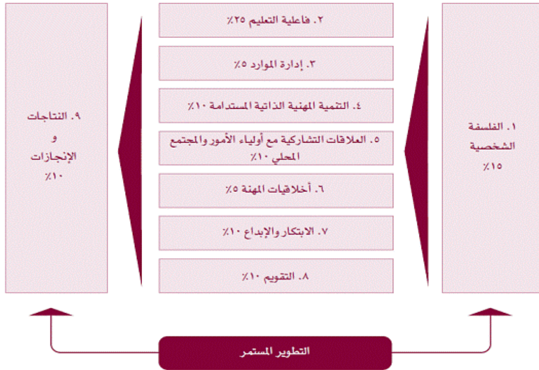
الشكل (١) تكامل معايير جائزة المعلم المتميز وأوزانها

وللاستمرار بالارتقاء والنهوض بأعمالها، تقوم جمعية الجائزة بمراجعة أعمالها بشكل دوري، ففي عام ٢٠١٠ قامت بمراجعة شاملة للدورات السابقة لجائزتي المعلم المتميز والمدير المتميز، وعقدت ورشات عمل لمجموعة من التربويين الأردنيين، تم على أثرها تطوير جوانب عدة من الجائزة والشكل (١) يظهر التكامل بين معايير الجائزة وأوزانها كما تم العمل على قواعد تصحيح خاصة لتقييم معايير الجائزة .