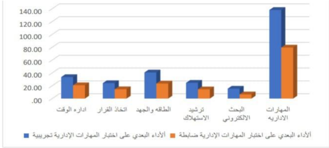
شكل (٣): التمثيل البياني لمتوسطي درجات تلميذات المجموعتين التجريبية والضابطة في مقياس المهارات الإدارية في الإقتصاد المنزلي.

يتضح من الجدول (٥) ومن خلال تحليل الرسم البياني لمتوسطي درجات تلميذات المجموعتين التجريبية والضابطة ان جميع قيم (ت) داله إحصائيا عند مستوي (٠,٠٥) (عند درجه حريه = ٥٨) مما يؤكد علي وجود فروق ذات دلالة إحصائية عند مستوي دلالة ( \alpha \leq 0.05 ) لصالح المجموعة التجريبية في القياس البعدي لمقياس المهارات الإدارية ككل والمهارات الفرعية (إدارة وقت ، إتخاذ قرار ، الطاقة والجهد، ترشيد استهلاك و بحث الكتروني) كل علي حدة نتيجة تأثرهما بالمعالجة التدريسية المستخدمة القائمة علي إستخدام الهواتف الذكية ، وبهذا يتم قبول الفرض الموجه الأول من فروض البحث ، والذي نص علي : أنه توجد فروق ذات دلالة إحصائية عند مستوي دلالة ( \alpha \leq 0.05 ) بين متوسطي درجات تلميذات المجموعة التجريبية ودرجات تلميذات المجموعة الضابطة في القياس البعدي لمقياس المهارات الإدارية في الإقتصاد المنزلي ، ولتحديد حجم أثر وفاعلية المتغير التجريبي المتمثل في الهواتف الذكية علي المتغير التابع المتمثل في المهارات الإدارية ، تم حساب قيمة ( d, \eta^2 ) ونسبة الكسب المعدل لبلاك MG_{Blake} بمعلومية متوسط درجات التلميذات في القياسين القبلي والبعدي للمقياس ذاته، ويمكن توضيح ذلك من الجدول التالي :