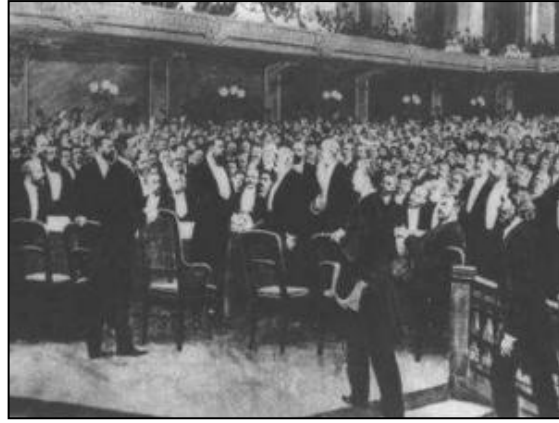
الشكل رقم (٣) : الوفود المشاركة في المؤتمر الصهيوني الأول