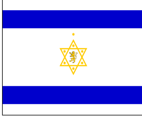
الشكل رقم (٢) صورة تعرض علم المؤتمر الصهيوني الأول

داخلي؛ بناءً على هذا؛ أقيمت الحواجز الأسمنتية والأسلاك الشائكة في وسط المدينة، ومررت بالقرب من باب الخليل في الجانب الغربي من البلدة القديمة، وأنشئت نقطة عبور عرفت بمعبر مندلباوم.