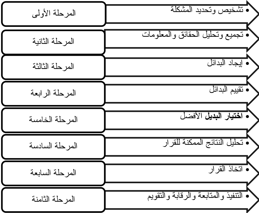
شكل رقم (٣) مراحل عملية صنع القرار

« عدم متابعة القرار بعد اتخاذه للتأكد من قابليته للتنفيذ. (السملي، ١٩٩٩، ١٠٨و١٠٧)