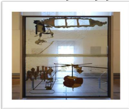
شكل (٤) (١)

*التجميع :هو فن يعتمد على قص ولصق العديد من المواد معا، وبالتالي تكوين شكل جديد. إن استخدام هذه التقنية كان له تأثيره الجذري بين أوساط الرسومات الزيتية في القرن العشرين كنوع من الفن التجريدي أي التطويري الجاد.