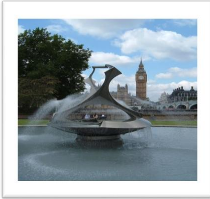
شكل (٢) (١)