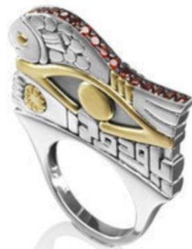
شكل (١) ١