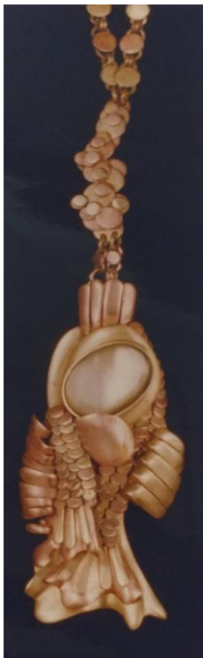
شكل (٣) ٢

ومن ضمن هؤلاء الفنانين الفنانة هند خلف مرسى التي صممت عقد بدلاية علي شكل سمكة وهي تعتبر مفردة من مفردات تراث الحضارة القبطية.