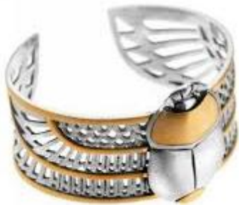
شكل (٢) ٢

القديم لذا سنجد الكثير من العلامات المميزة للحضارة مثل عين حورس في شكل (١) و الجعران في شكل (٢).