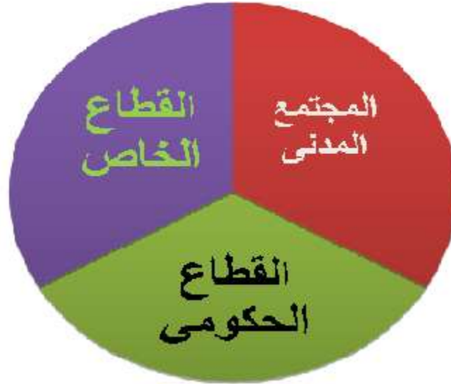
قطاعات المجتمع الثلاثة