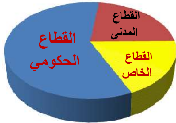
توزيع قطاعات المجتمع فى النظم الشمولية

وبين الحالتين المذكورتين بعاليه ، وهما بالمناسبة أقصى اليمين وأقصى اليسار ، هناك العديد من الدرجات التي تتبادل فيها القطاعات الثلاثة أحجامها وتأثيرها لتعبر في النهاية عن التوجه الاقتصادي والسياسي العام لنظام ما فى مجتمع ما .