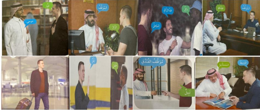
عدد الأدوار ٨ أدوار - عدد الصور التي تظهر بها ٢٥ صورة

- تكرار الشخصية الواحدة بصور متعددة، وتقمص أدوار مختلفة وأحيانا متضادة مما يجلب الملل ويدل على عدم صدق الصورة، والبعد عن الصور الطبيعية العفوية، وذلك مخالف للمعايير (4- 19) كما هو في الشكلين التالي .