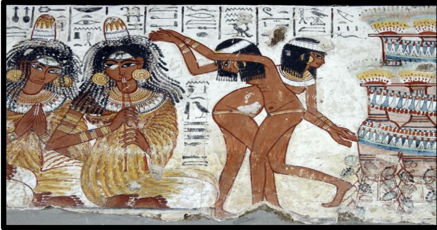
أحد الجداريات التي توضح أهمية الرقص والموسيقى... صورة رقم (2)

وقد أحرز المصريون القدماء قدرًا مهمًا من المعارف في حقول الفلك والهندسة والرياضيات والطب والفنون والدراما، وبعض ما توصلوا إليه ما زال معتمدًا في يومنا هذا وأهم هذه الفنون هي الدراما وكيفية توظيفها في فن الاستعراض الذي تناوله العديد من المصممين والمخرجين لتقديمه في قالب فرعوني متميز والذي سوف تقوم الباحثه بإلقاء الضوء عليه في السطور القادمة .