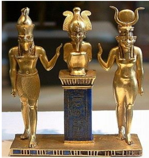
إيزيس وزوجها اوزوريس وابنها حورس... صورة رقم (6)

لم تستسلم إيزيس وتمكنت من جمع أشلاء زوجها، فحبلت وولدت إيزيس بعد ذلك ولذاً هو حورس، وأصبح أوزوريس ملكاً فى مملكة الموتى. ما تبقى من القصة يتمحور حول حورس، الطفل الناتج عن اجتماع إيزيس وأوزوريس، والذي كان فى بادئ الأمر مجرد طفل ضعيف تتولى أمه حمايته، حتى أصبح منافس ست على العرش. انتهى صراع ست مع حورس، الذي غلب عليه العنف، بانتصار حورس، مما أعاد إلى مصر النظام الذي افتقدته تحت حكم ست. كما قام حورس بعدها بإتمام عملية إحياء أوزوريس. تُكمل هذه الأسطورة، بما فيها من رموز معقدة، المفاهيم المصرية من نظام الملكية، وتتابع الملوك، والصراع بين النظام والفوضى، وعلى وجه الخصوص الموت والبعث بعد الموت. علاوة على ذلك، توضح الأسطورة السمات المميزة لكل شخصية من الآلهة الأربعة محور القصة وكيف أن كثيراً من العبادات فى الديانات المصرية القديمة يرجع أصلها إلى هذه الأسطورة.