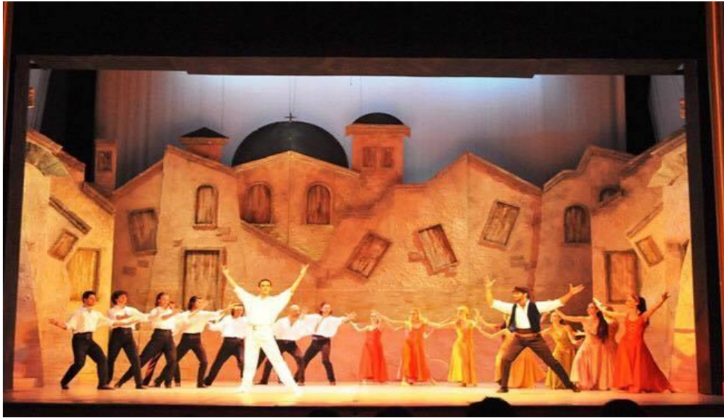
أحد رقصات باليه زوربا اليونانى لفرقة باليه أوبرا القاهرة... (14)

انتقل باليه زوربا لمصر لأول مرة عام 2000، عقب زيارة فرقة باليه أوبرا اليونان القومي، وتم إنتاجه من قبل دار الأوبرا المصرية عام 2004، ويتكون الباليه من فصلين، تدور أحداثه في إحدى القرى اليونانية عن قصة جون السائح الأمريكي الذي وصل إلي القرية ولكن أهل القرية يرفضون الاختلاط به خاصة بعد أن قامت علاقة حب بينه وبين الأرملة "مارينا" التي يحبها الشاب "يورجوس" ثم يظهر زوربا وهو شخص غريب عن القرية ملئ بالحيوية، ويصبح صديقاً لجون ويعلمه المعنى الحقيقي للحياة وهو أن نحياها ونستمتع بها علي الجانب الآخر تظهر شخصية مدام أورتانس وهي فنانة عجوز تحب زوربا وتحلم بأنها تتزوجه. (1)