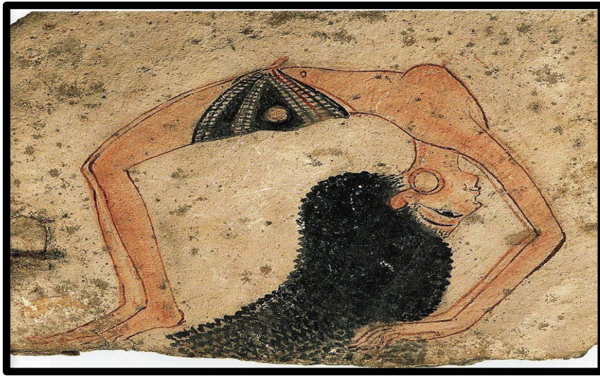
جدارية لأحد الراقصات في العصر الفرعوني ... صورة رقم (1)

لما يقرب من 30 قرناً - من توحيدها حوالي 3100 قبل الميلاد. إلى غزوها الإسكندر الأكبر عام 332 قبل الميلاد - كانت مصر القديمة الحضارة البارزة في عالم البحر الأبيض المتوسط، وبداية من الأهرامات الشهيرة مروراً بالفتوحات العسكرية في الدولة الحديثة، لطالما استحوذت جلاله مصر على علماء الآثار والمؤرخين وخلقت مجال دراسة نابض بالحياة خاص بها وهو علم المصريات. إن المصادر الرئيسية للمعلومات حول مصر القديمة هي العديد من الآثار والأشياء والتحف التي تم استردادها من المواقع الأثرية، المغطاة بالهيروغليفية التي تم فك شفرتها مؤخراً فقط.