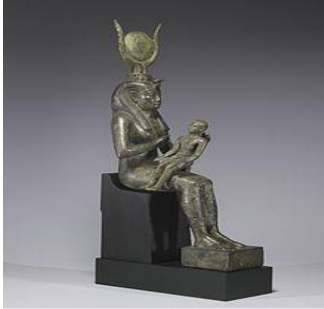
إيزيس تطعم حورس... صورة رقم (7)

اكتمل الشكل الأساسي لأسطورة إيزيس وأوزوريس في القرن الرابع والعشرين قبل الميلاد، أو ربما قبل ذلك، وقد تفرع كثير من عناصر الأسطورة عن أفكار دينية، إلا أن الصراع بين حورس وست من المحتمل أن يكون قد حدث بشكل جزئي بسبب الصراع الإقليمي بمصر في بدايات التاريخ أو في ما قبل التاريخ. وقد حاول العلماء أن يتبينوا طبيعة الأحداث التي أثارت هذه القصة، لكن محاولاتهم لم تأت بنتائج قاطعة. توجد أجزاء من الأسطورة في مجموعة متنوعة من النصوص المصرية القديمة، بدءًا من النصوص الجنائزية والتعويدات السحرية ووصولًا إلى القصص القصيرة. وبهذا تكون القصة أكثر تفصيلاً وتلاحماً من أي أسطورة فرعونية أخرى. لكن لا يوجد مصدر مصري يعطي فكرة كاملة وافية عن الأسطورة.