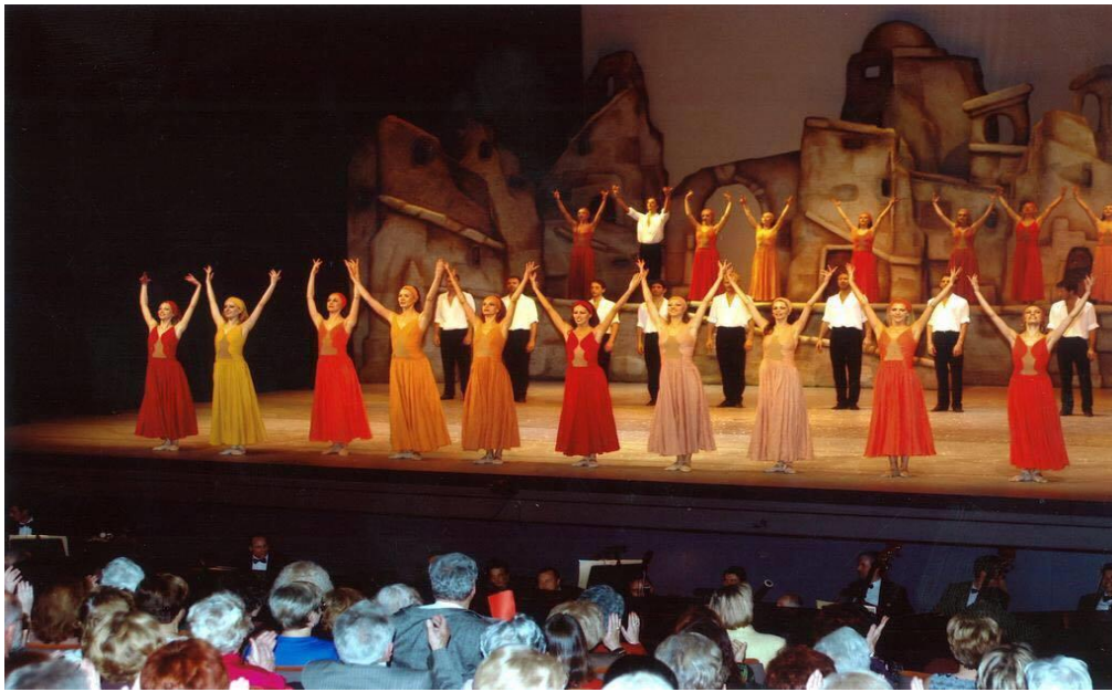
المشهد الختامى من باليه زوربا اليونانى ... صورة رقم (13)

لقد تبلورت فكرة تصميم باليه زوربا من خلال الإحياءات التي خالت بفكر المصمم ومن ضمن هذه الأفكار الأقوال المأثورة لمؤلف القصة مثل " أنا لا أؤمن بالصدفة "، ولكنى أؤمن بالقدر، ولقد أفضى النحت الغائر سر حياتي فيما يتعلق بالبساطة المذهلة، بل ربما سر حياة زوربا أيضًا، إنه ضريح لمحارب عاري لم يتخلى عن خوذته حتى في وفاته، وكان جاثيًا على ركبته اليمنى ويضغط على صدره براحتي كفيه وابتسامة هادئة ترسم على شفثيه المطبقتين. فالحركة الرشيقة للجسم القوي هي تلك التي لا يمكنك تمييزها إذا كانت تلك رقصة أم موت، أم أنها رقصة وموت معًا، وحتى إذا كانت موتًا، فإنه ينبغي لنا أن نحولها إلى رقصة.