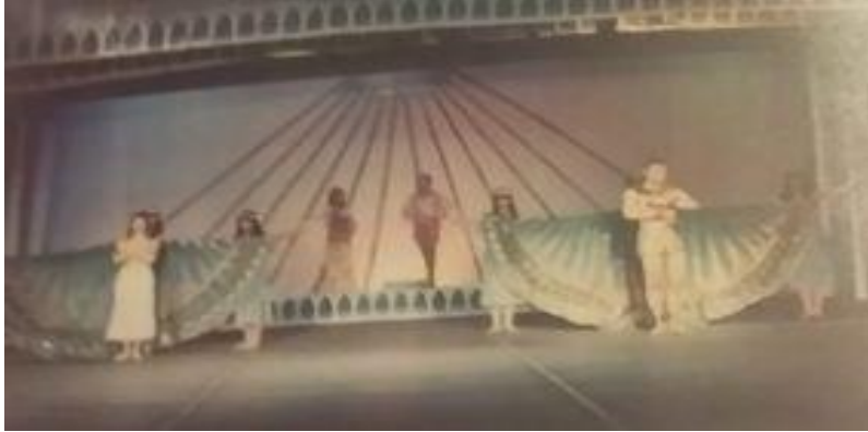
أحد مشاهد باليه إيزيس وأوزوريس لفرقة باليه أوبرا القاهرة ... صورة رقم (9)