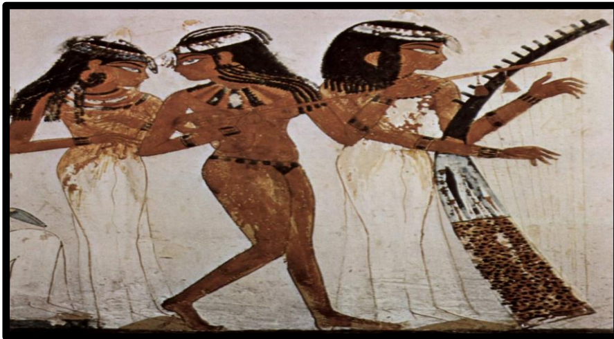
لوحة فرعونية تبرز أهمية الرقص والموسيقى في الدولة المصرية القديمة ... صورة رقم (3)

ان المصري الذي عاش في وادي النيل منذ أقدم العصور حياة تدرجت من حياة البدائية الى درجة عالية من الحضارة، كان في جميع ادوار حياته هذه يسجل الكثير من نواحيها تسجيلاً شاملاً شاهدنا فيه الكثير من عناصر الحضارة المختلفة التي فزنا منها بثروة طائلة من روائع الفن. (2)