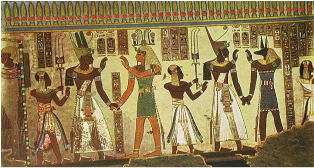
الرقص الفرعوني ومدى أهميته في الدولة المصرية ... صورة رقم (5)

يعتقد أن الرقصات بدأت أصلاً كطريقة لاسترضاء الإلهة سخمت التي كما تقول الأسطورة، دمرت تقريباً كل البشرية عندما سألها رب الشمس رع لمعاينة أولئك الذين نسيوه. على الرغم من أننا قد لا نعرف المعنى الخاص لكل خطوة، أو حركة قام بها راقص خلال أي رقصة معينة، إلا أننا نفهم أنها كانت ذات طبيعة دينية بالكامل تقريباً، وتهدف إلى التكريم، أو الاحتفال، أو الحزن، أو التهنية.