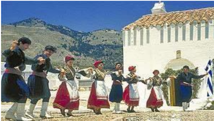
رقصة السيرتاكى يؤدها الشعب اليونانى فى المناسبات السعيدة ... صورة رقم (11)

رقصة السيرتاكى هي إحدى الرقصات اليونانية الشعبية التي صمم حركاتها مصمم الرقصات جرجس بروفياس لفيلم زوربا اليونانى عام 1964، ثم قام بعد ذلك لوركا ماسين بإخراجه كباليه . وتعتبر رقصه السيرتاكى من فنون الرقص اليونانى الحديث الذي يتسم بإيقاعه الخا، إذ أنه يمزج بين إيقاع الحركة البطيء والسريع للرقصة الشعبية الهاسابيكو، وقام بالتأليف الموسيقى المصاحب لها الموسيقار ميكيس ثيودوراكيس .