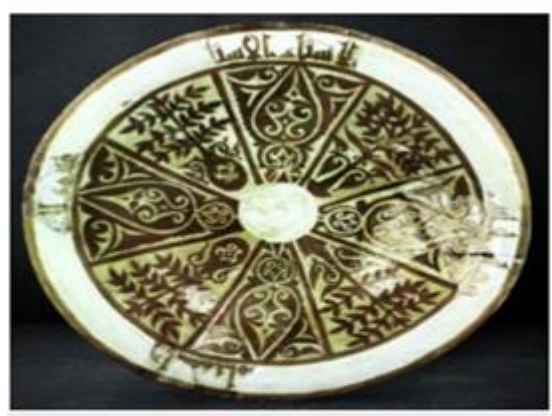
Ghapen dish شكل رقم (10)

والزخارف النباتية والكتابة الكوفية المميزة علي الاطباق القائد "غين" شكل رقم(10)