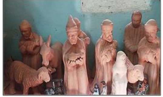
شكل (13) خزف قرية جراجوس بقنا تماثيل صغيره ارتفاع 20 سم للماجوس والرعاة

شكل (12) والمنحوتات المجسمة والبلاطات واوانى الزرع لذا تعد منتجات قرية تونس نموذج يحمل داخلها هوية وثقافات متعددة قبطية واسلامية وشعبية اصيلة سماتها تظهر في بساطة التعبير وفطرية الأداء الفني.