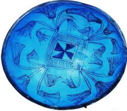
شكل (٢) إناء خزفي صغير حوالي ١٨سم من الفيانس الأزرق عليه رسوم نباتية تقرب لزهرة البشنين (اللوتس) حضارة البداري "المتحف البريطاني"

محروقة جيداً والتي عثر عليها ضمن آثار (دير ناسا) إلي الأواني ذات الجدران الرقيقة التي عثر عليها ضمن آثار (البدراي) "فكانت اوانى رقيقة اتخذوا من أشكال ورق الشجر وغصون النباتات بديلا عن خطوط الرسم المستقيمة شكل(٢) والتي تتميز بأسطحها الخارجية المصقولة، وأيضاً الأواني والمزهريات ذات الأسطح الخارجية الحمراء التي انتشرت في حضارة (العمري) والتي كان صانعوها يميلون إلي زخرفتها وتجميلها بزخارف مختلفة أغلبها خطوط وأشكال هندسية بيضاء ينفشونها على أسطحها الخارجية السوداء أو المزرقشة بألوان متعددة، وتعتبر مثل هذه التماثيل أو الزهريات نماذج رائدة طبقت هذه الصناعة بخصائص ظلت ثابتة طوال جميع حقبات التاريخ المصري القديم بكل عصوره." وعثر أيضا علي تماثيل صغيرة لنساء من الفخار الملون في حضارة نقادة الأولى والثانية وعرفت بتمائيل التراكوتا (الطين المحروق) فهي تحرق حرقاً أولياً علي درجات حرارة منخفضة بدون تزجيج وهي بوجه عام قليلة في الفن الفرعوني مقارنة بتمائيل الفيانس شكل (٣).