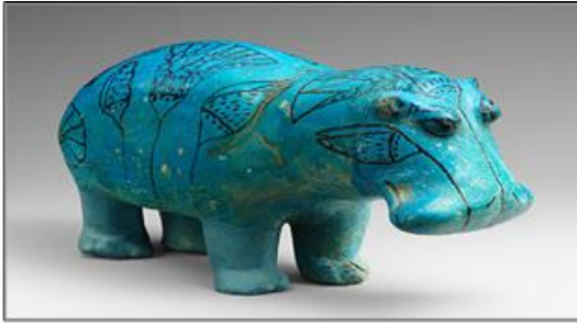
شكل (٥) فرس نهر 20سم * 7.5 سم من الفينانس المزجج ( لفينانس ) وقد رسمت أزهار لبشنيين على جسمه باللون الأسود لتصوير منفعة ليربدي لكي يعيش فيها من لؤلؤة لوسطى بالمتحف المصري

"وأخذ التمثال الخزفي مكانة مرموقة في الأسرات في معتقداتهم لدرجة أنهم اعتبروه في مرتبة المرافق للشخص الميت (الأوشابتي) شكل (٦) الذي سيقوم عنه بأداء الأعمال في الحياة الأخرى وهذا يوضح قيمة التمثال الخزفي أي أنه لا يستخدم للزينة فقط بل يقوم على تحقيق واجبات وعقائد دينية".