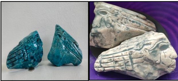
شكل (21) من أعمال الباحثة حجر تلك منحوت قبل عملية الحريق أثناء التغطيس وبعد مزج ذاتيا وتم حرقه علي درجة حراره 1100° م

مرت عبر العصور التاريخية القديمة والحديثة. فكان مولد فن الخزف بعد أن كان صناعة نفعية وحسب، إلا أن تطور هذا الفن لم يتوقف عند هذا الحد، فقد استمر في التوسع والتشعب حتى أصبح من الفنون القوية المعبرة ويقام لها بيناليات والورش الدولية التي يتبارى فيها الخزافون لإبداع الكثير من الأعمال التي تؤكد هويتهم الثقافية فتجذب كثيرا من السياح للحضور. لقد استطاع الخزاف الحديث الاستفادة من التقنيات الخزفية بأسلوب جديد يتناسب مع ذلك العصر من خلال تطبيق بعض التقنيات من أهمها تقنية العجنات المزججة ذاتياً (الفيانس) ( Faience ) " ويقصد بالعجان ذاتية التزجيج ما صنع من مسحوق الكوارتز مع إضافة الأكسيد الملون ، وقد كثرت المسميات لهذه العجينة المصرية القديمة ومنها ما يسمي التطيعيم بالزجاج (طلاء المينا) وفي قول آخر تعرف بالمادة الزجاجية الزرقاء الصناعية لأنها كانت تصنع بصهر الرمال مع برادة النحاس والنظرون" عن طريق الضغط في قوالب للتعبير عن ذات الخزاف وانفعالاته فالخزاف هنا يستغل كل القيم السطحية للخامة لصالح الشكل حتي يظهر في وحدة متكاملة فعند تنفيذ الشكل الخزفي يجب على الخزاف ان يراعي اهمية الطينيات الملونة في علاقته بغيره من العناصر والتقنيات المستخدمة وفي شكل رقم (14) مجموعة مختلفة من المنحوتات الخزفية الصغيرة المزججة ذاتيا (الفيانس) وهي نموذج للهدايا التذكارية صغيرة الحجم ذات طابع فرعوني عبارة عن احدى عشر شكلا من الخزف مختلف الألوان والاحجام جاءت بأشكال متقاربة وأحجام متقاربة وألوان مختلفة، وهي ذات طابع فرعوني يضيف نوعاً من التذكارية التاريخية التي تعطي بريقاً وتوجها للعمل وتعدد الألوان .