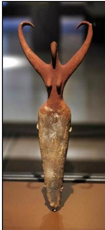
شكل (٣) تمثال لأمراة من الفخار الملون ( التراكوتا ) ارتفاع 29 سم نقادة الثانية عصر ما قبل الاسرات