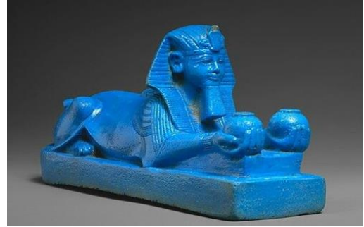
شكل(7) تمثال صغير من الفينانس لأبي الهول بوجه منحتب الثالث يقدم

وأيضاً ازهرت الدولة الحديثة والعصور المتأخرة بتمثيل من الفينانس (العجينة المصرية) الصغيرة لأشخاص مثل تمثال أبي الهول بوجه منحتب الثالث شكل (7) "وهنا اضيف إلي العجينة المصرية القليل من الطينة ليستطيعوا تشكيلها بشكل أفضل وكان يضاف لها ملح و كبريتات النحاس ليعطيها اللون الفيروزي. فكانت تشكل بالنحت فيه كتلة او التشكيل باليد أو ضغطه في قالب بسيط أو عجلة الخزاف فمن أشهر المنتجات التي نفذت بهذا الاسلوب هي تماثيل لأشخاص الدولة الحديثة وسلطين وكؤوس واواني ومجوهرات او حلي" (Friedman,F,D1998).