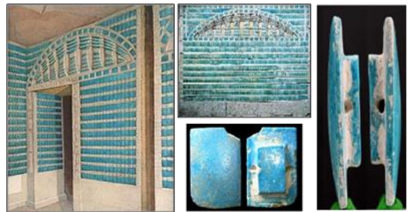
شكل رقم (٤) لوحة من الحجر الجيري المطعمة ببلاطات من الخزف المزجج هرم زوسر المدرج مع وضع جانبي للبلاطة . الأسرة الثالثة - الدولة القديمة مكان عرضه بالمتحف المصري رقم ( 68921 )

ولم يعثر على الكثير من القطع الخزفية، ولكن في ذلك الحين ازدهر فن الصناعات الصغيرة وأظهر الفنان تقدما في عمل العجائن ذاتية التزجيج، حيث ظهر في الأسرة الثالثة عجينة مزججة ذاتيا زرقاء، واستخدم في التشكيل القوالب لإنتاج الأعداد الكبيرة للبلاطات والألواح ومثال ذلك البلاطات المستخدمة في تطعيم حوائط الطرقات أسفل هرم زوسر بسقارة تصل إلى 36 ألف بلاطة مزججة باللون الأزرق المائل إلى الإخضرار شكل (٤). "وكانت الكتابات الهيروغليفية المنقوشة على التماثيل سواء كانت في قاعدة التماثيل أو في أماكن أخرى في التمثال فإنها تمثل إشارات سحرية أو عقائدية لخدمة صاحب التمثال في آخرته، كما اتسمت كل أعمال النحت بطابع فني واحد انفردت به "مدرسة منف" طوال عصورها".