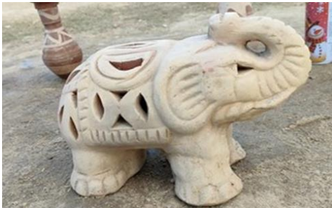
شكل (12) وحدة إضاءة أحد أعمال خرافين قرية تونس بالفيوم حوالي 25 سم عرض وارتفاع 21سم، تصوير الباحثة خلال الزيارة

ومنتجات قرية تونس الخزفية تتوافق مع مفهوم الصناعات الثقافية والفنية في تلبية الاحتياجات اليومية من وراء خلفية تراثية، وهو ناتج من التنوع الهائل في أشكال منتجاتها واستخداماتها كأطباق متعددة الشكل فإن الفيوم أصبحت مقصداً سياحياً سواءً كانت سياحة داخلية للمصريين أو خارجية للزوار الأجانب والقطع الخزفية المنحوتة في شكل وحدات الإضاءة كأبليك الإضاءة (المعلق- الجانبي- الأرضي).