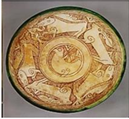
شكل (11) الحز والكشط في تجربة قرية تونس - الفيوم

البيضاء فتقنية تغطية الجسم الأحمر بطبقة من البطانة البيضاء ويضاف إليها أسلوب الحز والكشط في البطانة والتي تكشف لون الجسم الأحمر بلون غامق يوضح التصميم المرسوم معتمدا على درجة لون البطانة البيضاء ولون الجسم الأصلي الأحمر الغامق من على جسم الطينة الحمراء شكل(11)" رغم من بساطة هذه التقنية إلا أنها تحمل داخلها العديد من القيم الجمالية المرتبطة بحيوية التصميم وفطرية الأداء، وهي إحدى السمات المهمة في خزف الاستديو، الذي يحمل موضوعات ترتبط بالتراث القديم أو العادات الشعبية أو البيئة المعبرة عن المكان وتختلط مع جماليات الفن الإسلامي، فهي عناصر متشابكة تتجمع في إخراج العمل الفني أو القطعة الخزفية اليدوية التي تحمل بصمة متجددة.