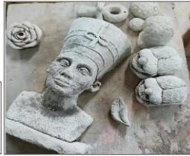
شكل (15) بعض من أعمال الباحثة أحجام صغيرة من المجنات ذاتية التزجيج أثناء التصفيف وخروج الأملاح على السطح

تجربة الباحث من خلال منحوتات خزفية صغيرة وتطبيق تقنية العاجن ذاتية التزجيج قام الباحث بإعداد خلطتين مختلفتين لهذه العجينة باستخدام أسلوب التزهر وأسلوب السمته ويمكن التشكيل بالعجينة بأكثر من طريقة ولكن انسيبهم بالضغط في قالب جصي أنسب الطرق في عمل أشكال من العجينة ذاتية التزجيج مع مراعاة عدم ترك العجينة بداخل القالب فترة طويلة حتى لا يمتص القالب الجصي الأملاح الموجودة في العجينة والتي نحتاجها لتكوين طبقة التزجيج بعد الحريق وشكل (15) يوضح نسخة مستخرجة من العجينة بعد تركها لتجف ويتم حرقها بدرجة حرارة 910° م ومن شكل 16 ل 18 بعض من أعمال الباحث.