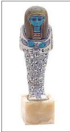
شكل (٦) لشبتي لبياح مس كاهن ووزير فنون بظبية أرتفاع 20سم وعرض 6 سم لؤلؤة لحديثة

"لقت بعصر بناء الأهرام من حوالي 2705 الي 2250 ق.م، وتبدأ الدولة القديمة ببداية الأسرة الثالثة وتنتهي بالأسرة السادسة، وقد جرت عادة الفراغة في هذا العصر علي تشييد أهرامات بالقرب من قصورهم لذلك سمي بعصر بناء الأهرامات وقد بلغت وحدة البلاد تمامها في هذا العهد، ويمتاز هذا العهد بالتطور السريع لفن العمارة والبناء والنحت والنقوش، وأهم ما تتسم به حضارة ذلك العهد هو طابعها المصري الصميم وروحها الخالقة المبدعة وتمكنت مصر أن تصل الي قمة مجدها في هذا العصر..