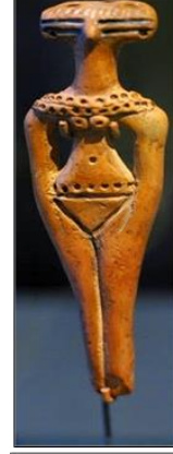
شكل رقم (١) دمية صغيرة من الفخار ٢ اسم QR Code

يتبع البحث المنهج التاريخي الوصفي وتجريبي من خلال تطبيق تقنية العجائن ذاتية التزجيج.