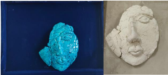
شكل (17) من أعمال الباحثة تشكيل يدوي قبل عملية الحريق وبعد من نتائج تقنية العجنات المتزججة ذاتيا (الفيانس) بأسلوب السمته في درجة 1010° م