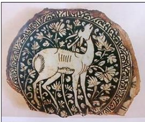
شكل رقم (9) سلطانية من الخزف من الخزاف المرسومه اسفل الجندب الشفاف من العصر المملوكي الاسلامي

ومن هنا فإن جمالية الخزف الإسلامي تأتي من التنوع في الأساليب والكيفية التي تشغل بها الوحدات الزخرفية والعناصر لتؤسس تكويناً محملاً بالضغوطات الفكرية والمضامين ذات المسحة الإسلامية والتي اصطبغت بها كل نتاجات الفن الإسلامي والذي من ضمنه فن الخزف، وهنا يكون للتنوع الأسلوب دوراً أيضاً في التفاعل الجمالي مع العناصر والوحدات الزخرفية والرسوم التصويرية، وعليه فإن تلك المزاجية ما بين الشكل العام للخزف الإسلامي، والإنشاء الزخرفي المنفذ عليه سيؤسس تكويناً شكلياً (9).