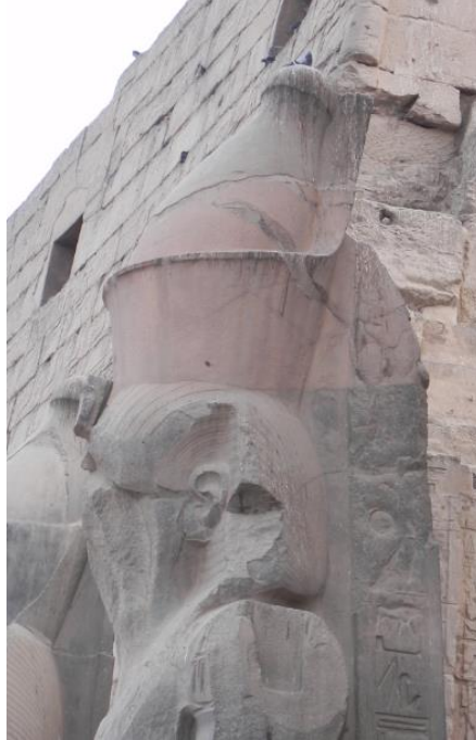
لوحة (2) 104 تمثال مزدوج للملك أمنحوتب الثالث مع حورس بن ايزيس (GEM 45833)