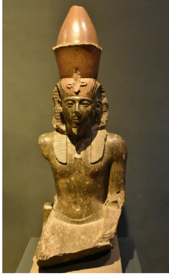
لوحة (4) تمثال الملك رمسيس الثاني بمتحف الأقصر (J. 1009)