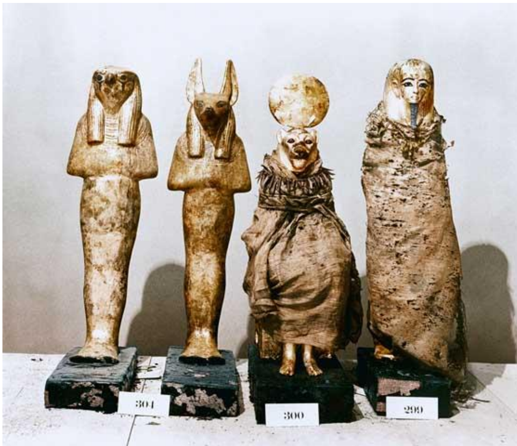
لوحة (9) 111 نماذج لتمثيل معبودات ملفوفة بالكتان، عُثِر عليها داخل مقاصير خشبية بمقبرة توت-عنخ-آمون