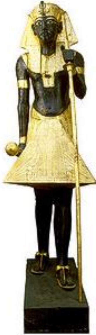
لوحة (8) 110 تمثل الملك توت-عنخ-آمون ممسكا بالعصا والمقمعة (GEM 5)