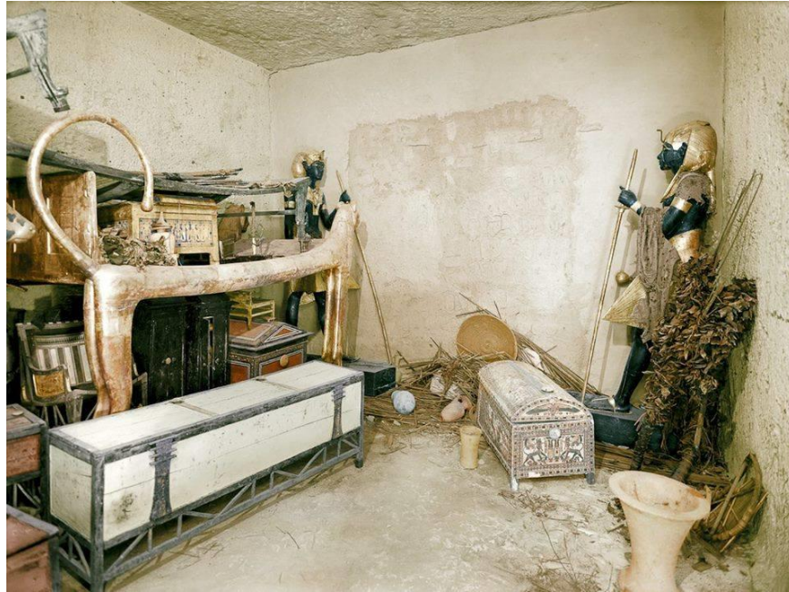
ب- 109 [تظهر بقايا غطاء الكتان على التمثال الأيمن GEM5]

لوحة (7) تماثلان للملك توت-عنخ-آمون لحظة الكشف- ممسكين بالعصا والمقعدة (GEM 4- GEM 5)