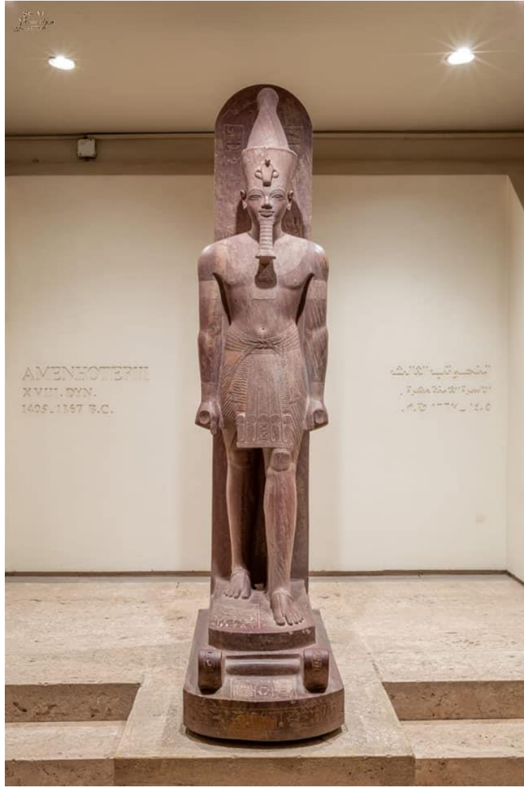
لوحة (1) 103 تمثل الملك أمنحوتب الثالث بمتحف الأقصر (J. 838)