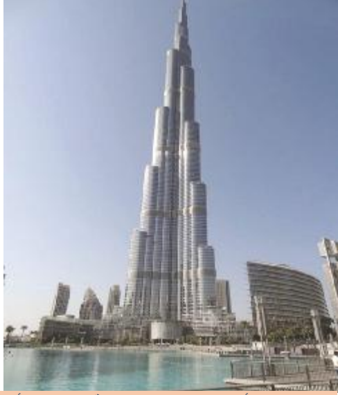
شكل يوضح أحد المعالم للمدينة المتميزة للمدينة التي تشكل أحد عناصر المصادر الثقافية

بنية تحتية مادية : وتشمل شبكات المياه والصرف الصحي ، والطاقة المتجددة والغير متجددة، وشبكات الاتصالات ، الطرق ، المطارات والموانئ. ١٢ بنية تحتية معنوية : تتمثل في كيفية تعامل المدينة مع المشكلات والفرص التي وتواجهها ، المناخ والحوافز الذي توفره للمبدعين ، دمج أصحاب المهارات العالية في السلطات التنظيمية والتنفيذية للمدينة