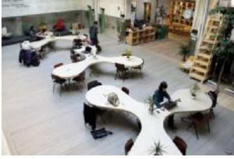
شكل يوضح creative hubs كأحد الأماكن التدريبية والتعليمية في المدن الإبداعية