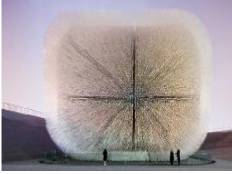
شكل يوضح أحد المعارض كاحد المباني الثقافية المكونة للمدينة الإبداعية

تشتمل على الساحات العامة التي تعتبر عنصر أساسي من عناصر المدينة يتم تصميمها بدرجة عالية من التميز لتساعد على جذب المستخدمين للتفاعل معا وخلق فرص جديدة للابتكار وحل مشكلات المدينة، وممرات المشاة و الدراجات حيث تشجع المدن الإبداعية تقليل استخدام السيارات في شوارعها للحفاظ على البيئة ، وإعطاء المستخدمين الفرصة بالاستمتاع بالبيئة المتقدمة للمدينة وحدث تفاعل بينهم .