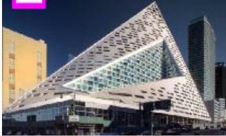
شكل يوضح أحد المباني السكنية الإدارية كأحد مكونات المدينة الإبداعية

يجب أن تصمم جميع المباني في المدن الإبداعية بطريقة مبهرة و مستدامة تدعم الإبداع والخيال ، وتضم المدن الإبداعية مركز المدينة ، مباني سكنية وفنادق ، مباني إدارية ، مباني تعليمية ، فراغات عامة .