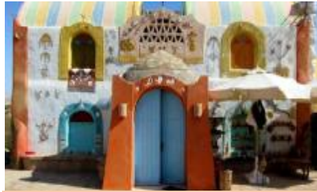
شكل يوضح أحد منازل النوبة كنموذج للتراث الحضاري

تشكل معايير المدن الإبداعية من خلال القدرة على جذب المواهب المبدعة ، وتوافر العناصر التي تحقق جودة الحياة ، وتوافر الصناعات الإبداعية ، وتوافر الأصول الثقافية ، وتوافر البنية التحتية الداعمة للإبداع ، وتوافر الوعي السياسي ، واتزان الاقتصاد الأساسي ، وتحقيق التعاون المجتمعي ، وتحقيق التفرد في المدينة ، وأخيرا تحقيق التنمية المستدامة ١٨ .