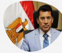
أ.د/ أشرف صبحي