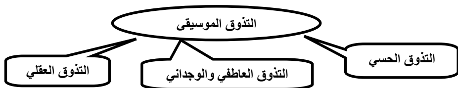
شكل (١) نموذج يوضح عناصر التذوق الموسيقي

يظهر الشكل رقم (١) أنّ التذوق الحسي يحدث عند الاستماع للموسيقى لمجرد التمتع بها فقط، وأنّ التذوق العاطفي والوجداني والذي يتم فيه ربط ما يسمعه الفرد بتجربة وجدانية مرت بحياته والتعبير عنه انفعاليًا كالهدهوء أو الغضب أو الفرح أو الحزن. وأنّ التذوق العقلي يتبين عند التعرف على جوانب العمل الموسيقي وعناصره (لحن – إيقاع- هارموني- تلوين صوتي - وسائل التظليل).