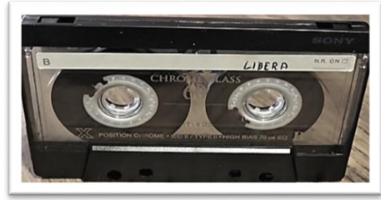
شكل ١ لشكل الفيلم على هيئة الكاسيت