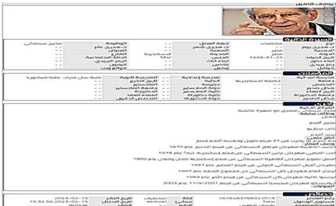
شكل ٤ نموذج لقاعدة بيانات لمخرج سينمائي