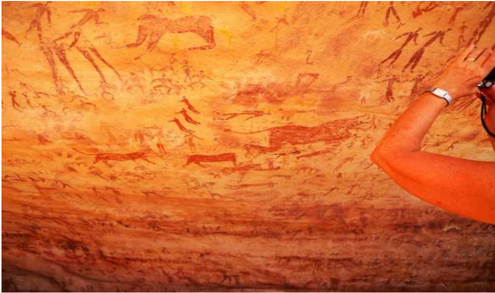
صورة رقم (3): توضح اهتمام السائحين بأهم رسوم الكهف وهو ما تم تسميته برسم الوحش مبتور الرأس الذي يقوم بالتهام بعض الأشخاص، بتاريخ فبراير 2019