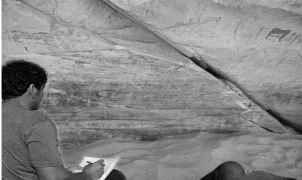
صورة رقم (5) للباحث أمام الجزء الشرقي للكهف وهو أكثر مكان يحتوي على رسوم الوحش مبيتور الرأس