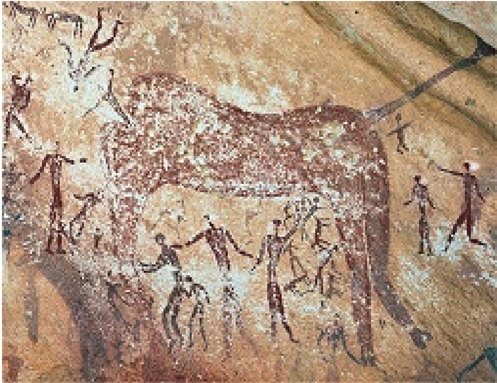
شكل رقم (1): يوضح كهف الوحوش

هناك مجموعات لا حصر لها من رسومات البشر، وكذلك الرقص، والتفاعل والمشاركة في الطقوس الديني، كما توجد رسومات لصيادين مع القوس والسهم، وأخيرًا مئات الرسومات لنسخ اليد، وأكثر ما يلفت الانتباه هو وجود أكثر من 30 رسمًا على هيئة وحش غامض بلا رأس يبتلع كل من حوله من رسوم الرجال، وهذا هو الموضوع الرئيسي للكهف والذي منه جائت التسمية (كهف الوحوش).