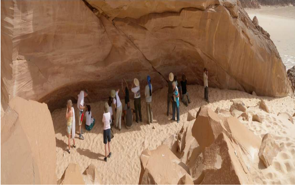
صورة رقم (4) للباحث مع المجموعة السياحية في حالة تأمل تام لتلك الرسوم الفريدة التي يتمتع بها هذا الموقع الذي يعد واحدًا من أهم مواقع الفن الصخري على مستوى العالم، صورة عن طريق الباحث، بتاريخ فبراير 2019