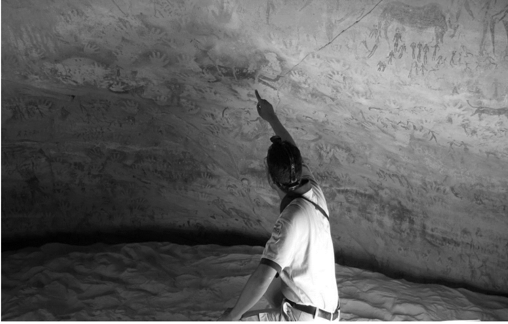
صورة رقم (2): للباحث يشير إلى رسوم الوحوش مقطوعة الرأس وهي من أكثر الأشياء الجاذبة للسياح، صورة عن طريق الباحث، بتاريخ فبراير 2019