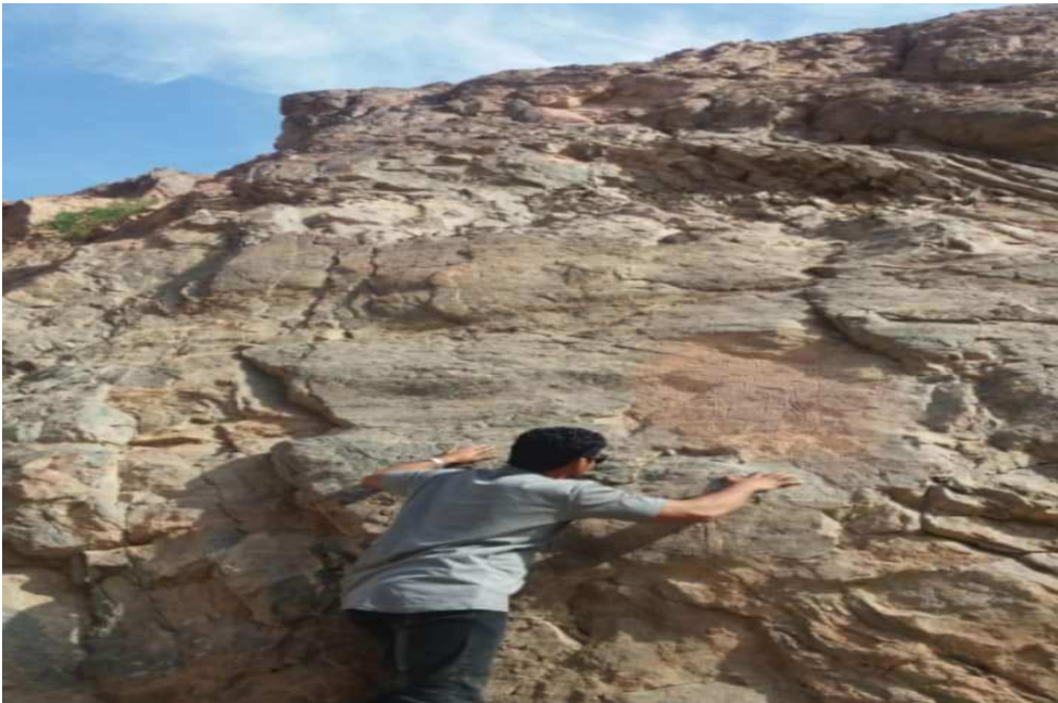
صورة رقم (6) للباحث أمام أحد الرسوم المقطوعة التي قام اللصوص بسرقتها صورة عن طريق الباحث، بتاريخ فبراير 2019

أثناء زيارة الكهف رصد الباحث الكثير من أعمال التخريب به، حسب ما قال اللواء المستكاوي مُكتشف الكهف أثناء المقابلة الشخصية معه، أنه من الواضح أن فيلم English Patient بطولة الشاب رالف فينيس في عام 1996 كان له تأثير كبير في جذب عدد كبير من السائحين، من ليس لهم وعي أثري لزيارة الكهف، لأنهم قاموا بالكتابة على الجدران وعلى الرسوم بطريقة غير مفهومة وغير مبررة، والأسوأ من ذلك، أنهم قاموا بقطع بعض الرسوم حرفيًا كي يأخذوها إلى المنزل كتذكارات. بالطبع فقد حدث كل ذلك بلا رقيب ودون أن يتصرف أحد من المسؤولين في الوقت المناسب لإنقاذ الكهف من مثل هذه الجرائم.