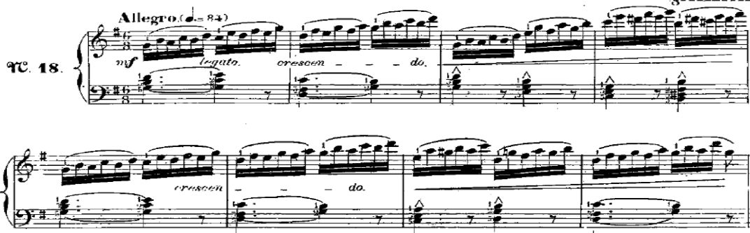
شكل رقم (١٠) يوضح من م ١: م ٨ للرسالة الثامنة عشر

وصف الصياغة: عبارة عن نموذج إيقاعي موحد في شكل مسافة ثلاثة صاعدة وهابطة متتالية تحت قوس لحنى ممتد فوق ٦ نغمات في اليد اليمنى يصاحبها اداء تآلفات ثلاثية تؤدي بأسلوب الضغط الثقيل والشكل التالي يوضح ذلك: