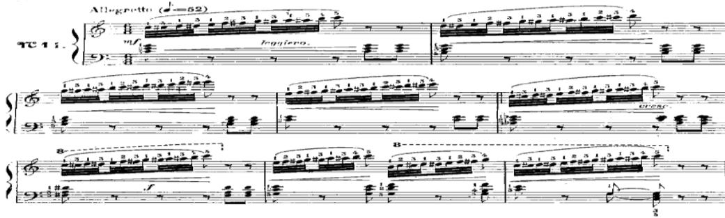
شكل رقم (٧) يوضح من م ١ : م ٨ للدراسة الرابعة عشر

* وصف الصياغة: جاءت الصياغة اللحنية بوليفونية في شكل نغمة ممتدة مع نغمات سلمية كروماتيكية صاعدة تحت قوس لحنى ممتد تؤدي بأسلوب العزف المتصل متدرجة في قوة الصوت يصاحبها نغمات هارمونية مزدوجة وتآلفات ثلاثية في اليد اليسرى وظهر ذلك في م ١ : م ٨ .