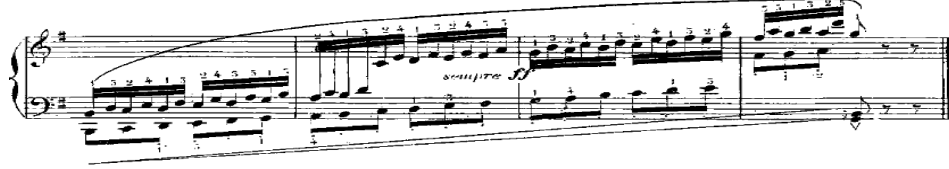
شكّل رقم (١٢) يوضح كودا من م ٢١ : م ٢٤ للدراسة الثامنة عشر

كودا: تبدأ بنفس فكرة الثالثات الصاعدة في اليد اليمنى واختلفت في المصاحبة وتغيرها الى مصاحبة سلمية صاعدة تؤدي بأسلوب العزف المتقطع و تنتهي بقفلة تامة في سلم صول ك والشكل التالي يوضح ذلك: