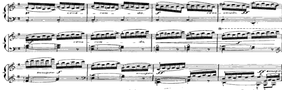
شكل رقم (١١) يوضح من م ٩: ٢٠ للدراسة الثامنة عشر