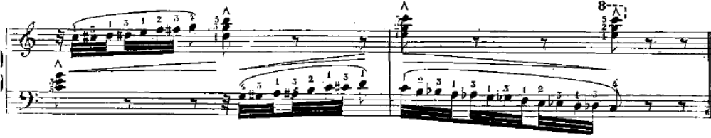
شكل رقم (٩) يوضح علامة الضغط القوي في م ١٥:م ١٦

علامة الضغط القوي (>) في اليدين وجاءت في م ١٥:م ١٦ والشكل التالي يوضح نموذج لذلك: