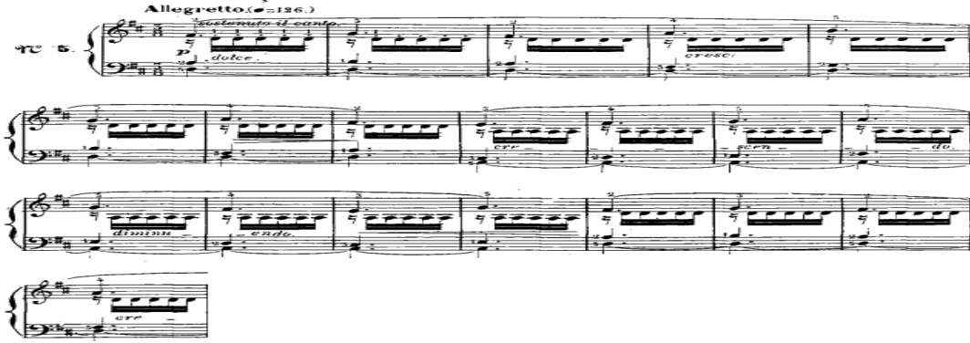
شكل رقم (٥) يوضح م ١: م ٢٠ للدراسة الخامسة

وصف الصياغة: عبارة عن خط لحنى بوليفونى قائم اداء نغمة ممتدة يليها نغمات ثابتة ومتكررة تؤدي بأسلوب العزف المتقطع تحت قوس لحنى ممتد في اليد اليمنى مع مصاحبة هارمونية لليد اليسرى عبارة عن نغمة ثابتة وممتدة ل ٨ موازير يليها نغمات متغيرة على ابعاد مختلفة، والشكل التالي يوضح ذلك: