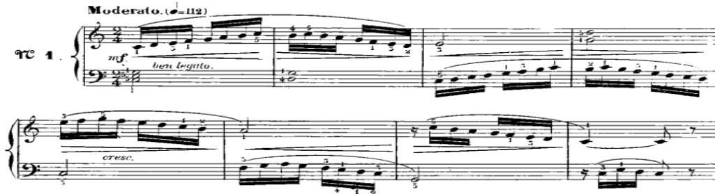
شكل رقم (١) يوضح من م: ١: ٨م للدراسة الاولى

ben legato ومعناه اداء متصل بالتبادل بين اليدين، والشكل التالي يوضح ذلك: