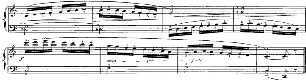
شكل رقم (٤) يوضح من م١٧:م٢٤ للدراسة الاولى