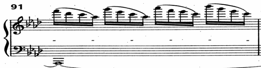
شكل رقم (٨) يوضح أقصى نغمة في مفتاح صول

جاءت أقصى نغمة أعلى مدرج مفتاح صول بنغمة (سي b) في م 91 والشكل التالي يوضح ذلك: