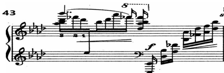
شكل رقم (٩) يوضح أقصى نغمة في مفتاح صول

جاءت أدنى نغمة أسفل مدرج مفتاح (فا) نغمة (مي b) في م ٤٣ والشكل التالي يوضح ذلك: