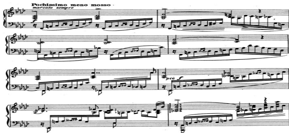
شكل رقم (٤) يوضح الفكرة الأولى من القسم الثاني من م ٢٣: ٣٠

عرض اللحن الجديد مستمد فكرته من اللحن الأول ولكن بإضافة العديد من الأساليب الزخرفية وإستخدام الكوردات والأوكتافات المصاحبة للنغمات المنفرطة في اليد اليسرى والشكل التالي يوضح ذلك