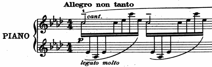
شكل رقم (١١) يوضح التقنية الأدائية الأولى في م ١

- التقنيات الأدائية التي جاءت بها الصعوبات العزفية في المؤلفات وطرق تذليلها قامت الباحثة بإستخراج التقنيات العزفية التي تواجه الطالب مع وضع التدريبات العزفية المقترحة بترقيم الأصابع لتذليل أداؤها وفيما يلي حصر للتقنيات العزفية وتدريباتها - التقنية الأدائية الأولى :