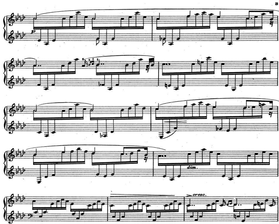
شكل رقم (٣) يوضح الفكرة الثانية من القسم الأول م ١٢: ٢٢

القسم الثاني (B) من م ٢٣: ٤٧ مستمدة فكرتها من نفس الفكرة اللحنية للمؤلفة التي ظهرت في القسم الأول غير أنها تختلف في تتابع نغمات التآلفات المنفرطة وتنقسم الى فكرتين الفكرة الأولى من م ٢٣: ٣٠ -