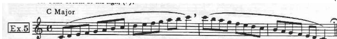
شكل ( ١ )

في تمرين رقم (٥): اكد علي دراسة السلالم الكبيرة والصغيرة الميلودي، كما عرض ان كل موسيقي محترف اعتاد أداء السلالم يوميا، قام بترتيبهم بتتابع خامسات (دو- صول- ري....) كما قام بوضع مكان اخذ النفس واوصي به: كما أشار الي أهمية التدريب ببطيء كما موضح في شكل (١)