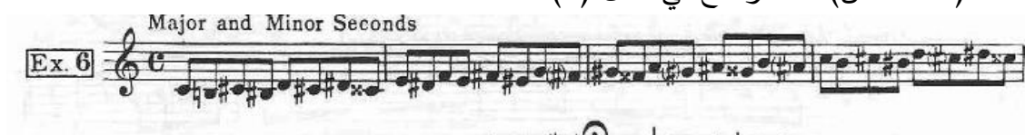
شكل ( ٢ )

في تمرين رقم(٦) بعد دراسة السلالم الدياتونية انتقل لاداء النغمات الكروماتيكية بتتابع يتناول مسافة (٢ك، ٢ص) كما موضح في شكل (٢)