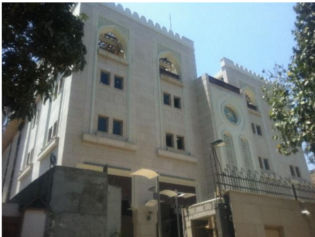
شكل رقم (1) يوضح الواجهه الخارجيه لسفارة سلطنة

ويتطلب تحقيق منظومة التواصل تحميل المعاني بالقيم التراثية وإيداعها في تشكيل يحمل شفرة أولغة تتوافق مع طبيعة سلوك الزائر المعاصر، ومن ثم تأتي أهمية الاتجاه الداعي إلى أهمية إحياء التراث من خلال الربط الفكري بين التراث والمعاصرة بكونه محدداً للتصميم الداخلي للمنشآت الدبلوماسية، و مثال علي ذلك سفارة سلطنة عمان بالقاهرة : صمم الواجهه علي الطراز الاسلامي العماني نلاحظ ان تصميم الواجهه متأثراً بتصميم العمارة الحربية التي تتسم بها سلطنة عمان حيث الاسوار العليا و تكسيه الواجهه من الحجر و يظهر ايضا في تصميم الدروه العليا للواجهه و التي تشبه تصميم دروه قلعه نزوي بسلطنة عمان.