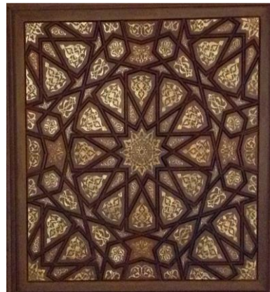
شكل رقم (6) للوحدة