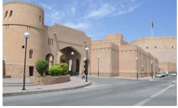
شكل رقم (2) يوضح الواجهه الخارجيه لقلعه نزوي بسلطنة عمان

المادية والغير مادية داخليا وخارجيا" وفي ذات الوقت ذات توافق مع ما يحيط به من الحياة بالبيئة الطبيعية. ومع هذا المنطلق تكون الوظيفة الأساس للعمارة البيئة من خلال (اعتماد الطول الذاتية) من البيئة المحيطة في ظل متطلبات واحتياجات الإنسان الأساسية مع مراعاة الحفاظ على الطبيعة والتراث الثقافي للمكان والاعتبار في الحفاظ على مفهوم الاستدامة Sustainability وهو ما يعني تحقيق احتياجات الحاضر دون التأثير على المستقبل 2 .