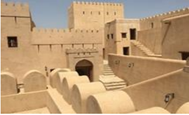
شكل رقم (3) يوضح تصميم الدروه لعليا لقلعه نزوي بسلطنة عمان