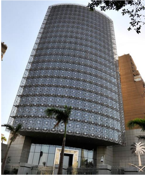
صورة رقم (5) صياغة وتشكيل للوحدة مبني المملكة العربية السعودية بالقاهرة