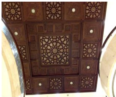
شكل رقم (7) تكرار نفس الوحدة بنسبه مختلفه