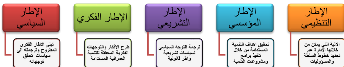
شكل رقم ١- أطر الحوكمة الفاعلة والمحققة لأهداف التنمية

* التعرف على الاطر الداعمة لنظم الحوكمة العمرانية الفاعلة