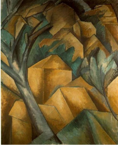
شكل (٧) اسم العمل: بيوت الاستياك للفنان: جورج براك المادة: زيت على كائفاس تاريخ الإنتاج: ١٩٠٨ م