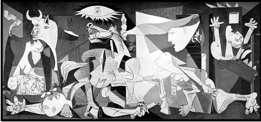
شكل (٣) لوحة (جيرنيكا) متحف (برادو) بمدريد-الفنان بابلو بيكاسو عام ١٩٣٧م

كما وظهرت فلسفة الأيكولوجيا الاجتماعية تعبيراً عن الواقع السياسي في لوحة (الجرنيكا) شكل (٣) حيث أُرِدا من خلالها التعبير عن أحداث هامة ومصيرية وقعت على مجتمعه، وإحتجاجاً على القصف الوحشي لبلدة جيرنيكا خلال الحرب الأهلية الإسبانية بقنابل الطائرات الألمانية، ويذكر أنه "يتناول بها قضايا المجتمع وهموم الإنسان ومشاكله، فلم يكن الفنان يهدف من خلال أعماله التصويرية الجانب الجمالي فقط والذي يعتمد على تزيين الحجرات، وإنما يهدف من خلال صورة إلى مناقشة قضايا، ومشاركة إيجابية في مشاكل المجتمع، ويعكس من خلالها آراؤه وانفعالاته بأمور المجتمع وشؤونه الداخلية والخارجية (أميرة حسن فهمي محمد شكري: ٢٠٠٠م، ص ٢٥).