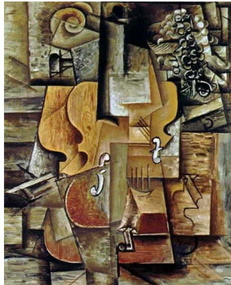
شكل (٤) لوحة: حياة ساكنة مع كمان وفواكه اسم الفنان: بابلو بيكاسو المادة والخامة: ورق لاصق وفحم على ورق تاريخ الانتاج: ١٩١٣ م نقلًا عن: www.wikiart.com

كما يعتبر جورج براك (Georges Braque) * المؤسس المشارك إلى جانب بيكاسو في بناء المدرسة التكعيبية، ومن خلال أعماله يتم تجزئة العناصر وإعادة بنائها بأشكال هندسية، وقد عبر من الإيكولوجيا الاجتماعية من خلال التكوينات