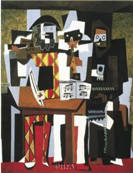
شكل (٢) اسم اللوحة: الموسيقيون الثلاثة، بيكاسو تاريخ الإنتاج: ١٩٢١م مادة اللوحة: زيت على كanvas وكولاج

الدعارة العديدة به، نظر بيكاسو الى مفهوم الجمال في تشخيصه للنساء بطريقة غير تقليدية، اختار عدم عرض جمال المرأة كما فعلت اللوحات الأوروبية التقليدية، الشخصيات الخمسة التي تظهر في اللوحة يحدقن بجرأة، وقد تم رسم وجوههن باستخدام أشكال هندسية حادة" ( www.youm7.com )، حيث تظهر كل شخصية بوضعية مختلفة، والتي تعبر عن انعدام الاخلاق والقيم المجتمعية... وكذلك وفي لوحة (الموسيقيين الثلاثة) شكل (٢)، حيث عبر الفنان عن مشاهد من الواقع الاجتماعي والمتمثل بفرقة المسرح الروماني للجلباب المهرج التقليدي بأسلوب (الكوميديا ديل أرت) للشخصيات الرئيسية في لوحته، "تظهر التكعيبية المسطحة بمعناها التحليلي وهو تراكم الأشكال بحيث تكشف بعضها عن البعض الآخر، وهذا الكشف للأشكال وتداخلها وذذببتها، يساعد العقل على التركيز على مجموع الصورة كتكوين، بدلاً من انصرافه إلى موضوع التعبير. وبذلك نجد أن المدخل التكعيبية يقترب من مجال الفن وقضاياها، أكثر من الاهتمام الدارج بالموضوع واعتباره مقياساً للفن (محمود البسيوني: ١٩٨٣م، ص١٠٦-١٠٧).