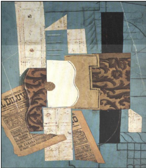
شكل (٥) اسم اللوحة: جيتار اسم الفنان: بابلو بيكاسو الخامة والمادة: حبر- فحم- ورق ملون سنة الانتاج: ١٩١٣ م

اللوحة إلى خارجها.... كما وفي لوحة أخرى لبيكاسو بعنوان (جيتار) شكل (٥) ينشئ من خلال هذا اللوحة تراكماً شكلياً هندسياً يعتمد على أسلوب التكرار لمجموعة من الآلات الموسيقية المجردة في علاقات ونظم فنية متراكبة لآلة الجيتار والتي تتخذ أوضاع وأساليب فنية مختلفة، حيث تتوسط اللوحة التصويرية كعنصر سيادة في بناء ثنائي مرة يتخذ نصف الجيتار اللون الابيض ومرة اخرى يتخذ اللون البني المزخرف، ومستعيناً بأوراق الجرائد الملصوقة (تقنية الكولاج) فوق النص وكأنها تمثل أوراق النوتة الموسيقية المستخدمة، فيما عالج فضاء اللوحة مستخدماً اللون الأزرق الداكن..