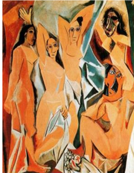
شكل (١) اسم اللوحة: نساء أفينون، بيكاسو تاريخ الإنتاج: ١٩٠٧ مادة اللوحة: زيت على كanvas