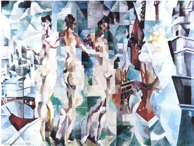
شكل (٩) للفنان روبرت ديلوناي، اسم العمل: مدينة باريس المادة: زيت على كائفاس تاريخ الإنتاج: ١٩١٠-١٩١٢م

(مدينة باريس)، شكل (٩)، تناول فيها الإيكولوجيا الاجتماعية من خلال المشهد لمدينة باريس ونجد اللوحة تتضمن ثلاثة سيدات عرايات كعناصر سيادة في اللوحة التصويرية ورموز أخرى معمارية كبرج ايفل، قام الفنان بتحطيم الصورة الحسية للمشهد الحسي الواقعي وحولها إلى صياغة هندسية من خياله وفق رؤيته الخاصة، واستبدال المنظور التقليدي بمنظوره الخاص، ومعتمداً على ايقاعات لونية بين الفاتح والغامق توحي بنور يتخلل اللوحة.