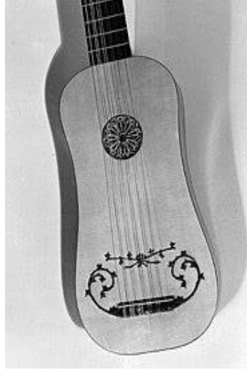
آلة الفيهولا (2) - Vihuela

vihuela على أنها "موسيقى العود الإسبانية" لأن آلة العود المعروفة بـ lute آلة مختلفة عن آلة الفيهولا (1).