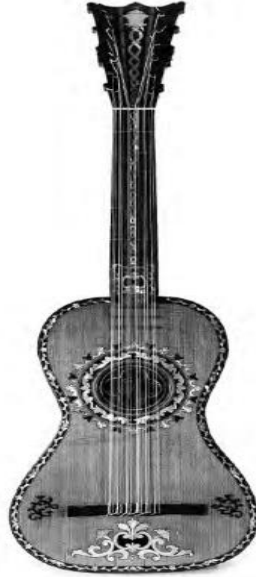
Pl. 12.1. Guitar bearing the label 'Por Lorenzo Alonso en Madrid año de 1786'

أنتشر الجيتار المكون من ستة أوتار أنتشاراً واسعاً ليس فقط بأسبانيا ولكن بإيطاليا وفرنسا وألمانيا وإنجلترا والكثير من الدول المجاورة حتى أصبح له شعبية كبيرة ليس فقط بدول أوروبا ولكن فى العالم حتى حلول القرن التاسع عشر وأصبحت الآلة فى هذه الفترة الموضحة وتطورت تطوراً ملحوظاً فى شكلها وفى طرق وأساليب العزف عليها وظهرت مدارس جديدة لتعليم العزف على الجيتار الكلاسيكى بجانب المدارس التقليدية التى توارثت وازداد عدد العازفين والمُقبلين على شراء آلة الجيتار الكلاسيكى المكون من ستة أوتار حتى أصبحت الآلة فخراً للشعب الأسباني بأنها أول آلة تُصنع بأسبانيا وتنتشر هذا الانتشار الرهيب لأن أسبانيا بلد النشأة لآلة الجيتار الكلاسيكى المتعارف عليه إلى يومنا هذا وأيضاً المدارس الأندلسية هى أساس التعليم للمبتدئين على آلة الجيتار الكلاسيكى الأسباني وستظل المدارس الأندلسية هى الأساس والتاريخ المورث فى تعليم الآلة بتقنياتها وأساليب