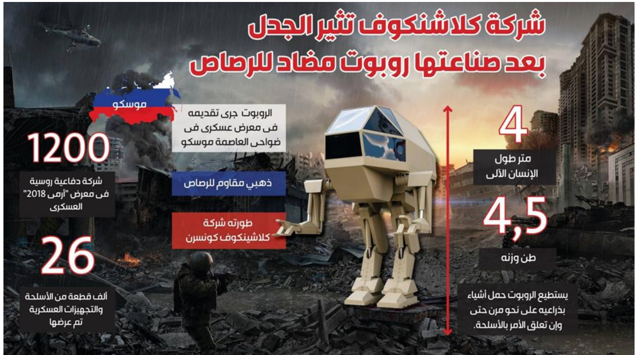
شكل رقم (2) تصميم الإنفوجرافيك المصحوب بنص

أختبر من خلال هذا التقرير تأثير متغير طريقة عرض التصميم على معدل فهم وتذكر الباحثين عينة الدراسة للمحتوى، وتم حذف فقرة من هذا التقرير حتى لا يكون طول الخبر عاملاً مؤثراً على فهم الباحثين وتذكرهم، أو عبئاً على إدراكهم، وصمم في شكلين: الشكل الأول عبارة عن إنفوجرافيك مصحوب بنص التقرير كما هو موضح في الشكل (2)، والشكل الثاني عبارة عن إنفوجرافيك مستقل بذاته كما هو موضح في الشكل (3).