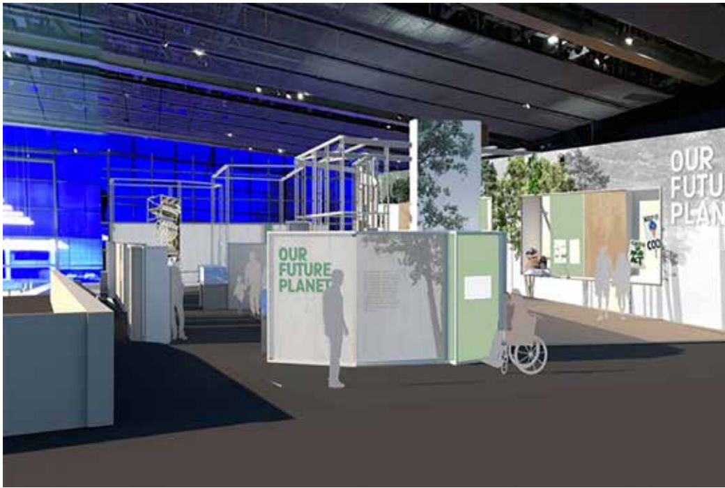
شكل (أ): تصور للمصالة التقديمية لمعرض كوكبنا المستقبلي بمتحف العلوم لندن.