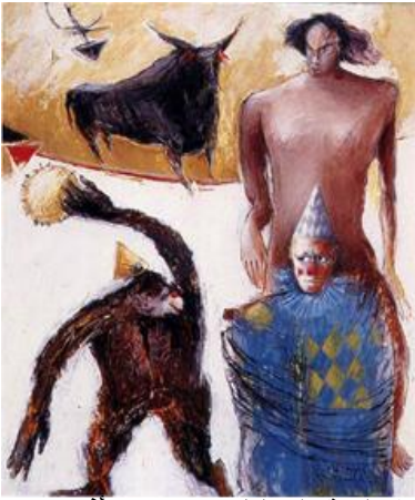
شكل رقم (١٠) الفنان رؤوف رأفت، من خفايا السيرك ٣، ألوان اكريلك علي كرتون، ٥٢×٤٨ سم، ١٩٩٩م

تمتاز أعمال الفنان رؤوف رأفت (١٩٤٨ - ٢٠٠٥) باستخدام الرمز التعبيري الخاص فشخصية المهرج عند الفنان تتأرجح في إيماءاتها بين الملهاة والمأساه .. بين حرية الجسد وأغلال الروح ، حتى أنه يرسمه بريئاً كالأطفال تارة ، ومصفداً كالأسير تارة أخرى، وتكاد تشعر في كثير من الأعمال أن ذات الفنان تتوارى خلف شخصية المهرج ، وتحرك من خلالها دراما الصورة وفورانها التعبيري (١) . فيظهر لنا في مجموعة أعمال الفنان تحت عنوان "من خفايا السيرك" والمنفذة من خامة الأكريلك يظهر المهرج في حراك إنساني ينزاح معه الرمز مثلما يفتفى الظل أثر