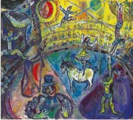
شكل رقم (٨): مارك شاجال، جواد السيرك ١٩٦٤، لوحة زيتية ٤٩،٤ × ٦١،٨ سم. مجموعة خاصة، نيويورك (٢) .

وإذا كان ثمة عنصر رنان نابض في لوحات شاجال التي تدور حول أنشطة السيرك فهو ألوانه المشعة، ففي لوحة (جواد السيرك) شكل رقم (٨) نلاحظ الألوان المتألفة المتواشجة التي تتبدى في تلك العروض كذلك أجمل شاجال في ذلك العمل معظم عناصر ألعاب السيرك مجتمعة بما تزخر به من موسيقيين ولاعبين وحواة وبهلوانات وحيوانات السيرك، الأمر الذي شكل لوحة بانورامية شاملة تعرب عن عشقة الجنوني لعروض السيرك.