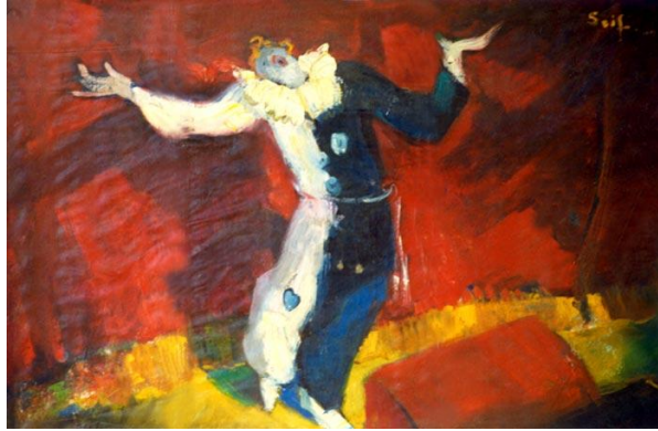
شكل رقم (٩): سيف وانلي، البلياتشو ليون كرافليو، زيت على ورق ٤٥،٥ × ٣١،٥ سم ١٩٤٨ (٣) .

يعد الفنان سيف وانلي (١٩٠٦-١٩٧٩) وأخاه أدهم وانلي من معالم الفن السكندري فيما بين الأربعينيات حتى السبعينيات، وقد تميزا بطلاقة هائلة وطاقة على التجديد وتوليد الأفكار، فتميزت أعمالهم بحساسية اللمسة السريعة، التي تحتفظ بحرارة المشاعر، وقد اهتمتا بتصوير مشاهد المسرح والأوبرا والرقص الكلاسيكي والشعبي والسيرك "حيث بدأت علاقة الأخوين وانلي بحياة الليل والمشاهد التي تغمرها الاضواء الصناعية من عام ١٩٤٦، عندما زار الإسكندرية سيرك (تونى) وقدم عرضه هناك، وقد ذهب الأخوان وانلي ليجلسا في ركن بعيد عن المشاهدين، ويرسما تخطيطاتهما التي سجلت حركات اللاعبين والموسيقيين والحيوانات والاستعراضات" (١) . "فرسم سيف البلياتشو (ليون كارفيللو) عام ١٩٤٨، واتسم بالحركة والتعبير عن هذا العالم، من خلال شخصية البلياتشو" (٢) . شكل رقم (٩) فيظهر ليون كرافليو يتوسط العمل الفني وهو يحي جمهوره بعد تقديم العرض مرتدياً زي مهرج باللون بارده فنصفه ملون بالازرق القاتم والنصف الاخر بالابيض الناصع ليعبر عن حالة التضاد في حياة المهرج بينما أشعل الخلفية باللون النارية الملتهبة ليبرز ويؤكد صخب العرض والأجواء.