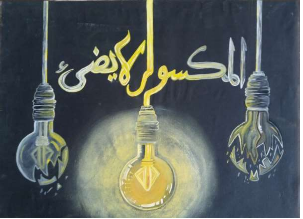
الملصق الإعلاني الخامس عشر يعبر عن الحكمة (المكسور لا يضيء)