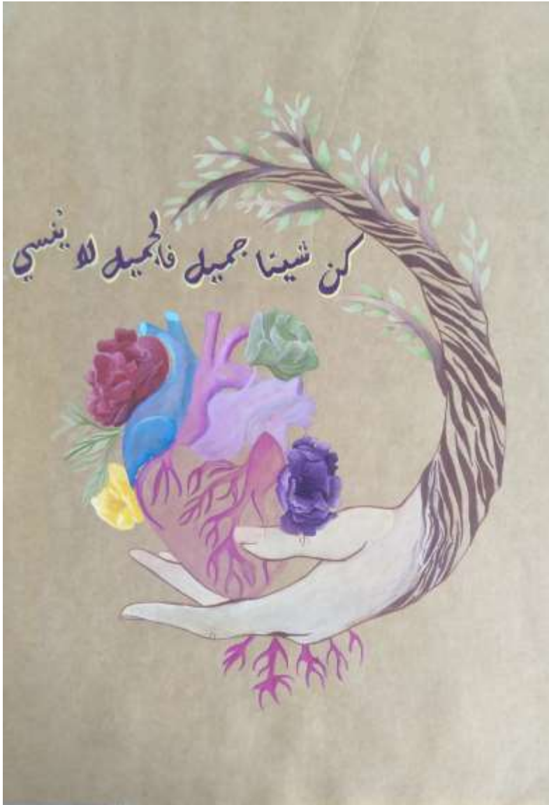
الملصق الإعلاني الثاني والعشرون يعبر عن الحكمة (كن جميلاً فالجميل لا يُنسى)