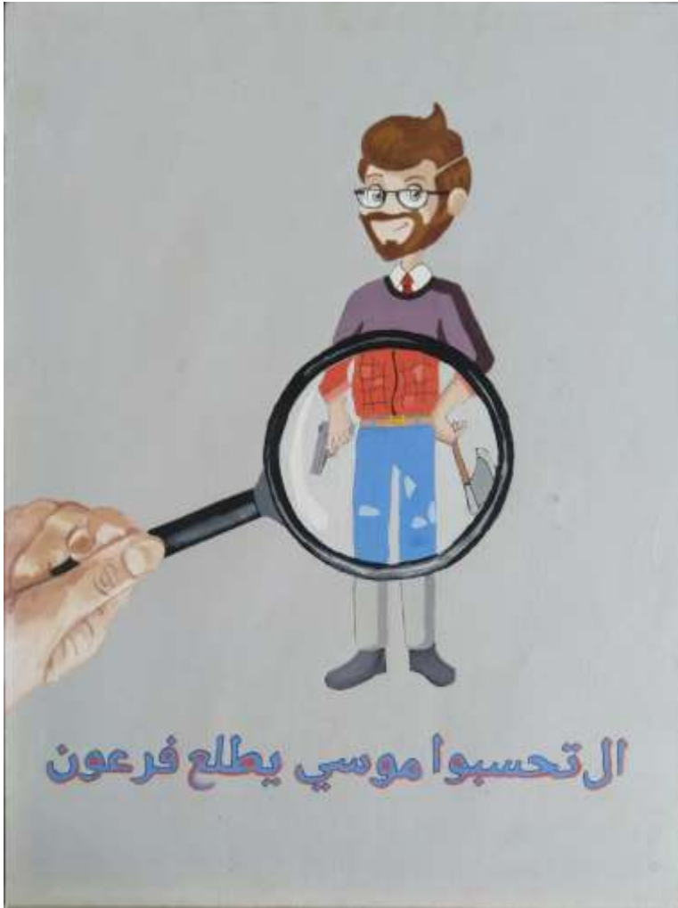
الملصق الإعلاني الأول يعبر عن المأثورة الشعبية (ال تحسبوا موسى يطلع فرعون)