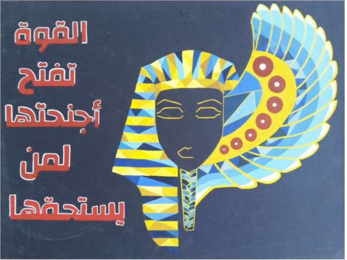
الملصق الإعلاني الثالث عشر يعبر عن الحكمة (القوة تفتح ذراعيها لمن يستحقها)