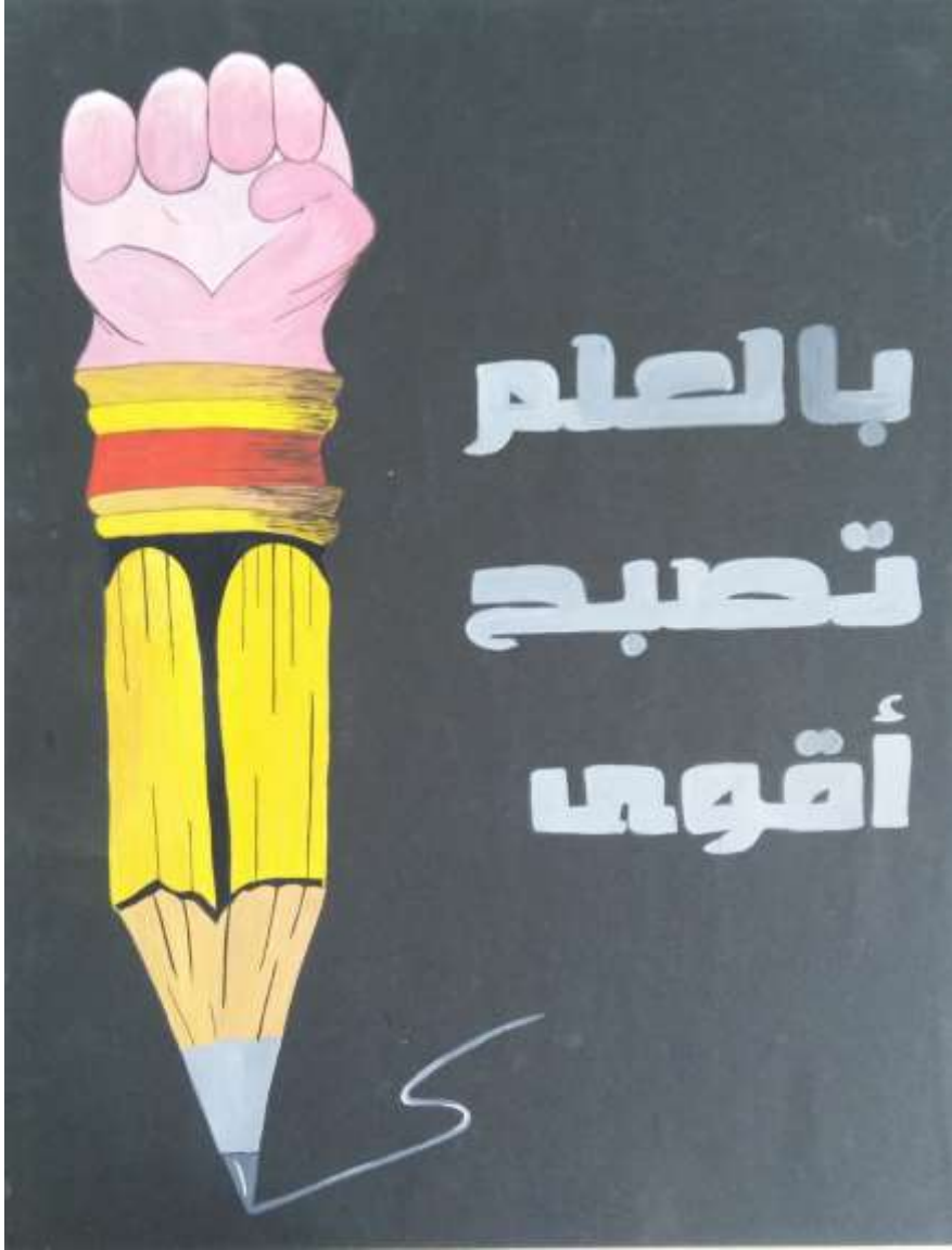
الملصق الإعلاني الرابع عشر يعبر عن الحكمة (بالعلم تصبج أقوى)