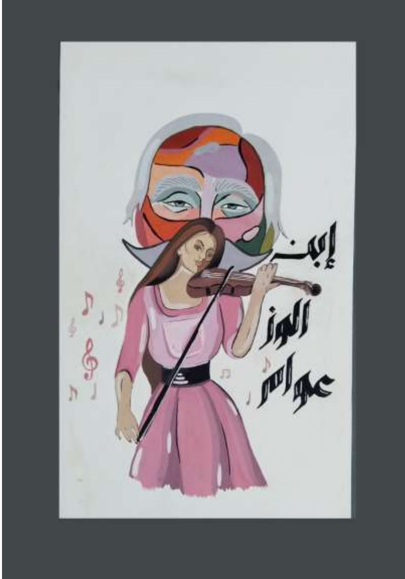
الملصق الإعلاني الخامس يعبر عن المأثورة الشعبية (ابن الوز عوام)