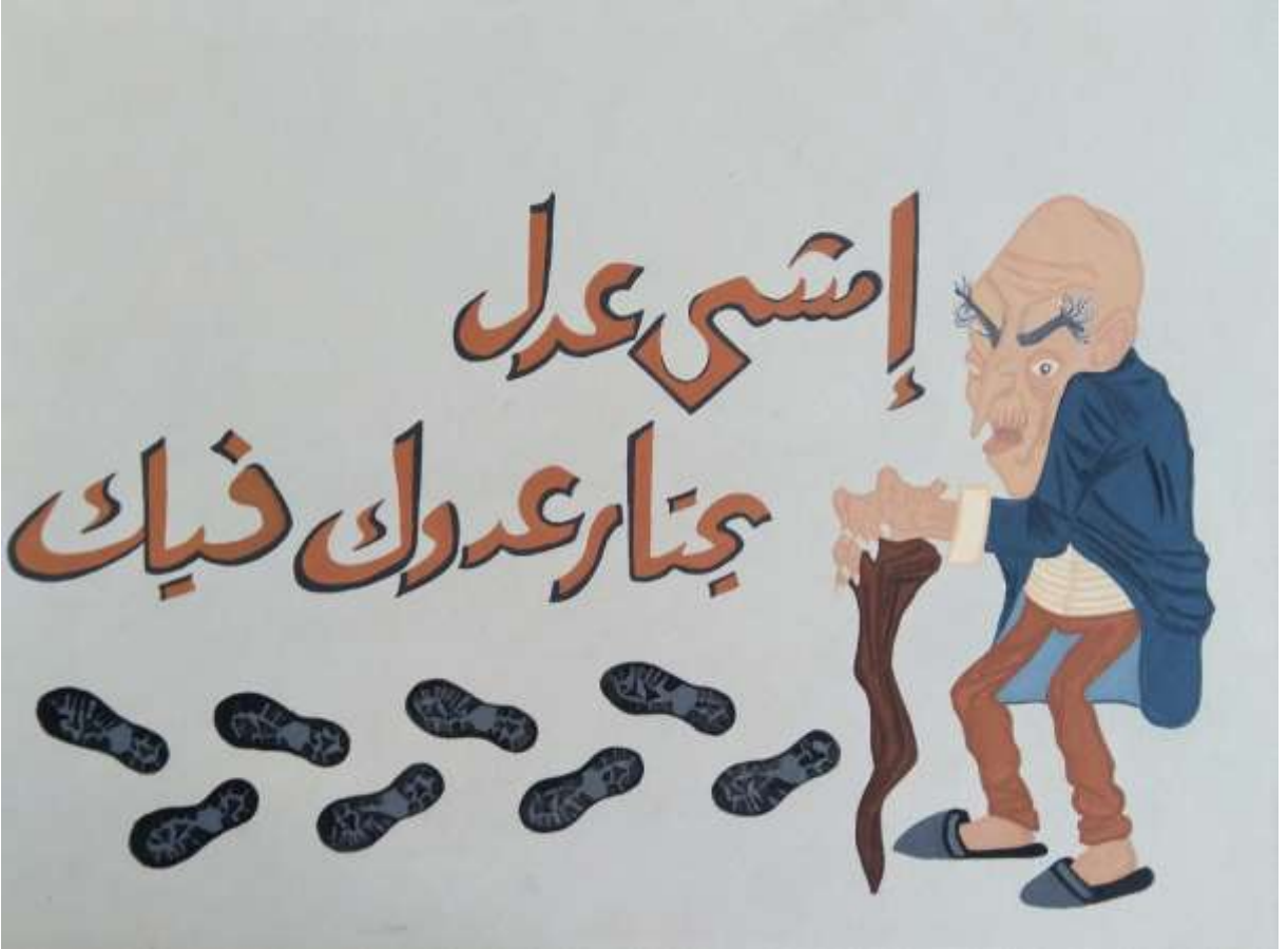
الملصق الإعلاني الرابع

يعبر عن المأثرة الشعبية (إمشى عدل يختار عدوك فيك)