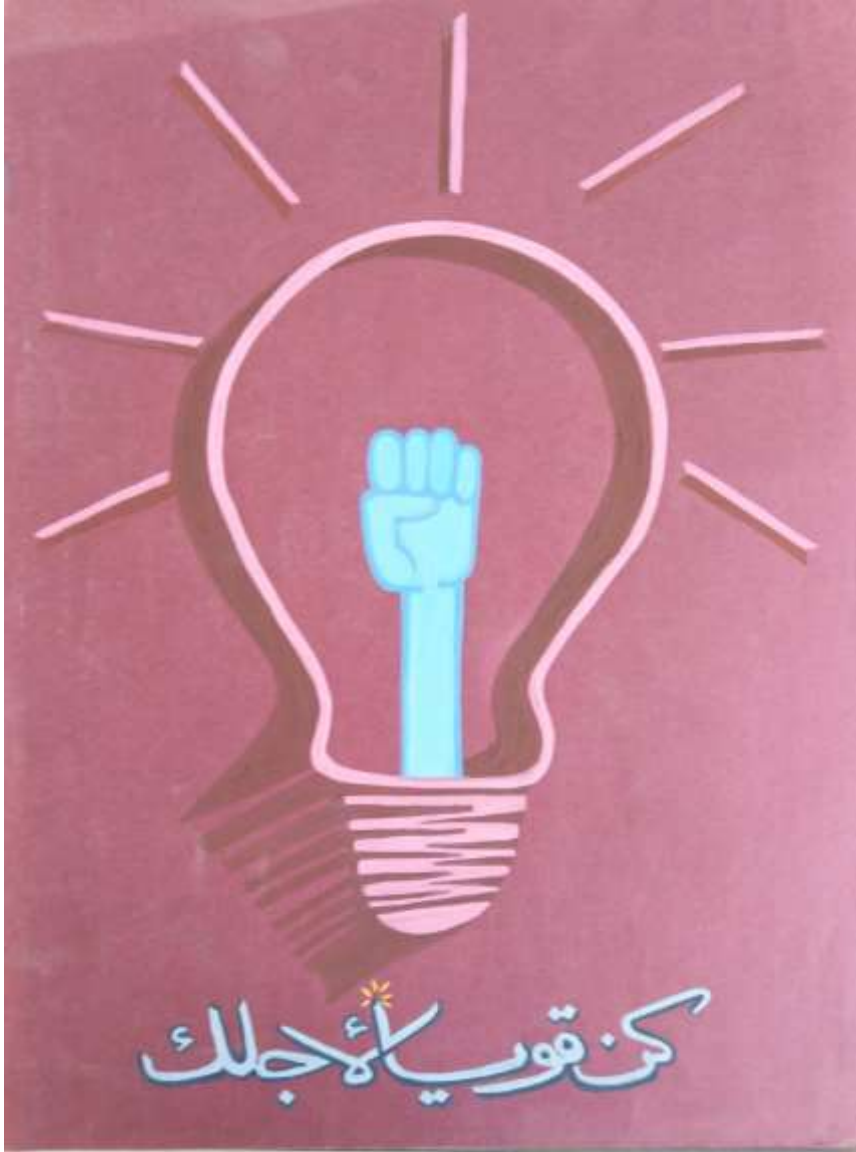
الملصق الإعلاني الثالث يعبر عن المأثورة الشعبية (كن قويا لأجلك)