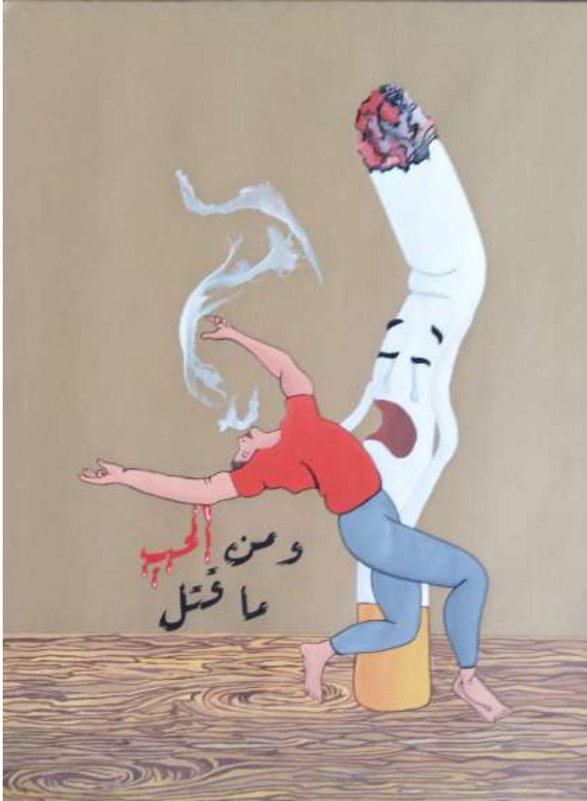
الملصق الإعلاني السابع يعبر عن المأثورة الشعبية (ومن الحب ما قتل)