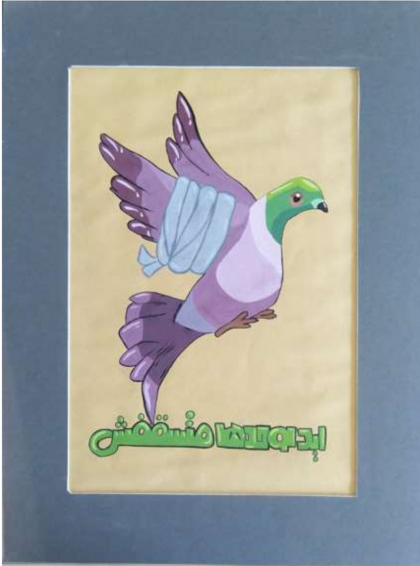
الملصق الإعلاني السادس يعبر عن المأثرة الشعبية (إيد لوحتها ماتسقفش)