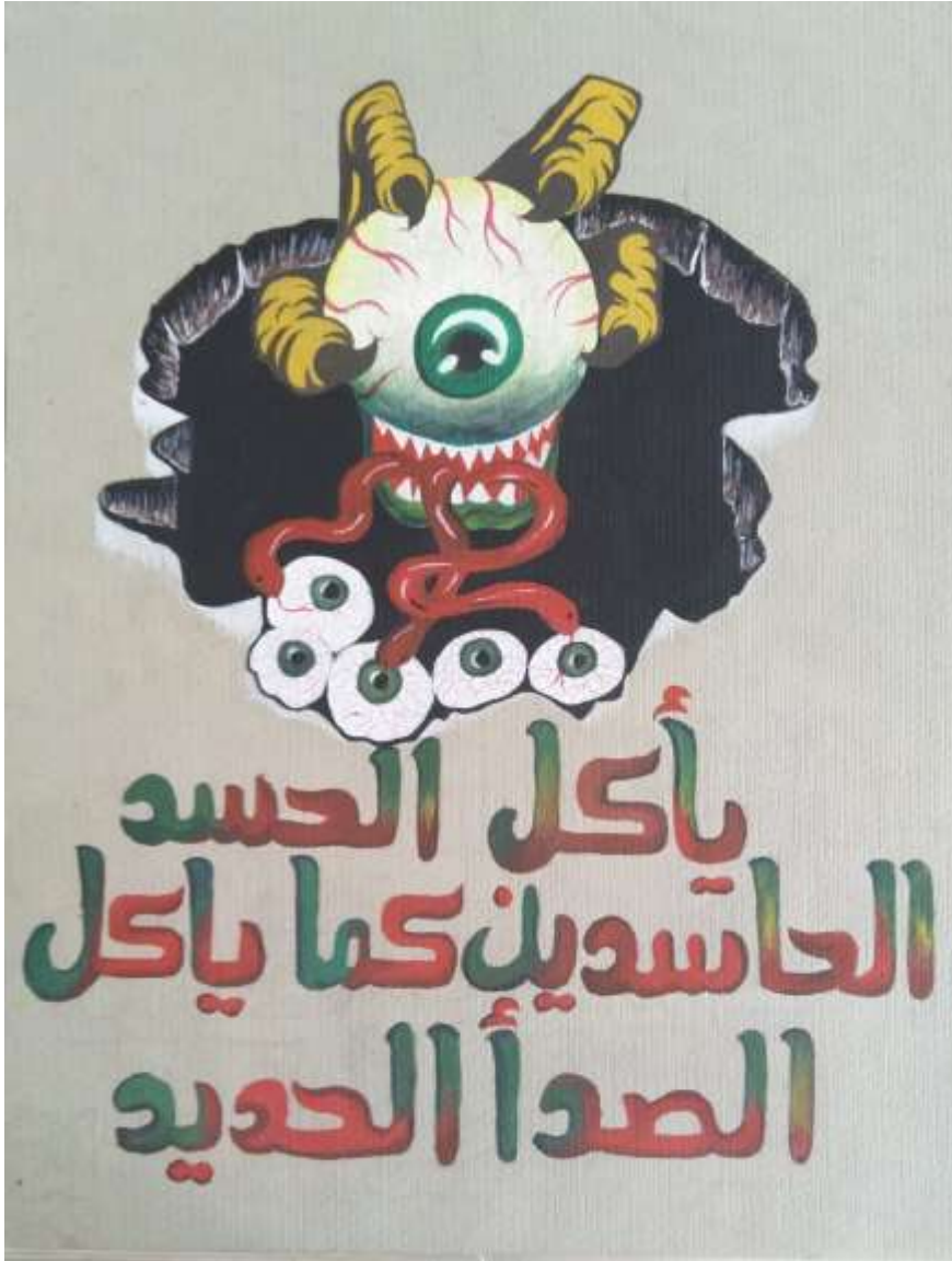
الملصق الإعلاني الحادي عشر يعبر عن الحكمة (يأكل الحسد الحاسدين كما يأكل الصدأ الحديد)