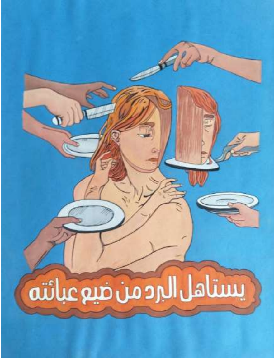
الملصق الإعلاني الحادي والعشرون يعبر عن الحكمة (يستاهل البرد من ضيع عبائته)