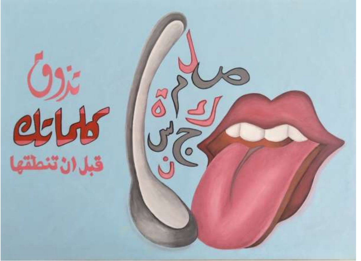
الملصق الإعلاني الثاني عشر يعبر عن الحكمة (تذوق كلماتك قبل أن تنطقها)