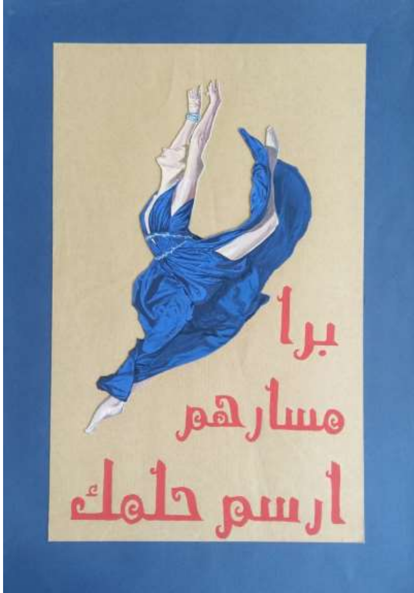
الملصق الإعلاني التاسع عشر يعبر عن الحكمة (برا مسارهم ارسم حلمك)