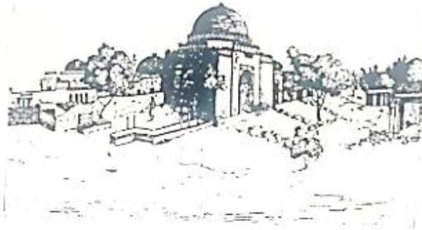
ضريح فيروز شاه تغلق نقلًا عن آثار الصناديد ج ٣ رقم ١٠٢