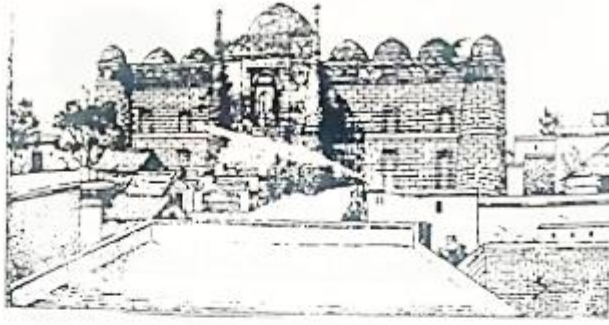
تصميم مسجد كني نقلاً عن آثار الصناديق ٣ رقم ٢٢٤