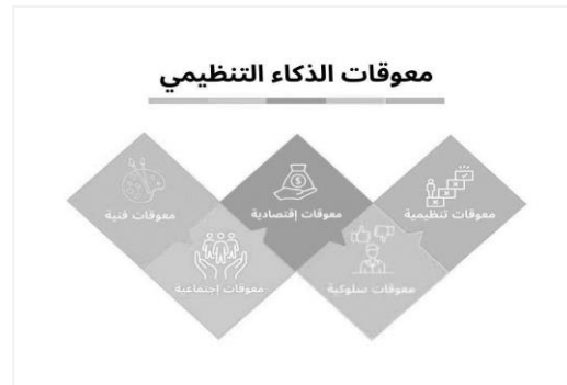
شكل (2) معوقات الذكاء التنظيمي