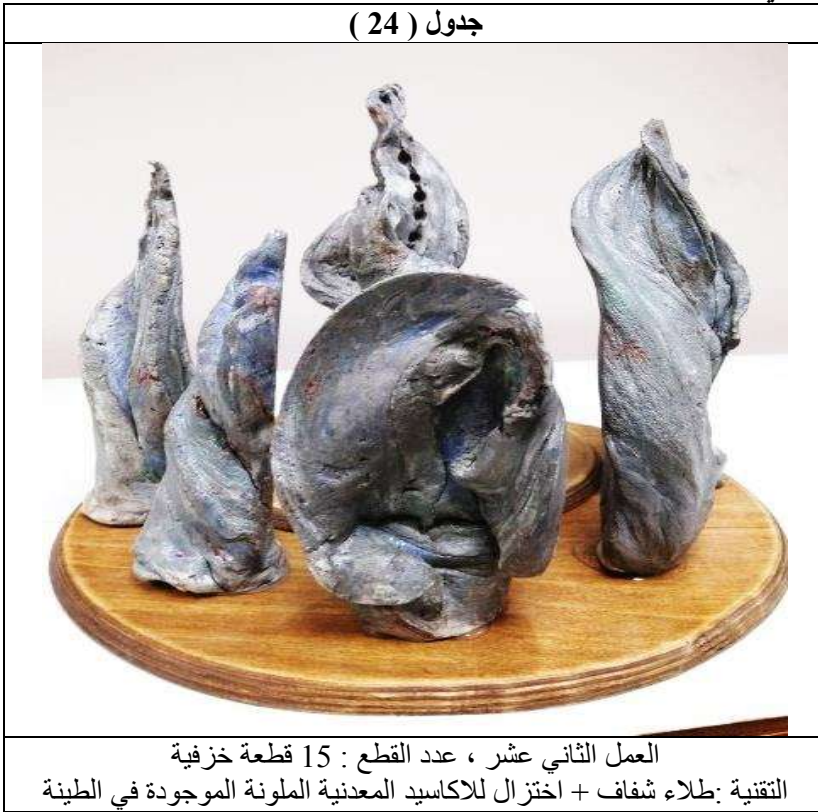
العمل الثاني عشر ، عدد القطع : 15 قطعة خزفية التقنية : طلاء شفاف + اختزال للاكاسيد المعدنية الملونة الموجودة في الطينة

لقد جاءت ايجاءات الحركة في هذا العمل لتعكس بعض حركات الاشخاص في أوضاع مختلفة بعضها في حالة استقامة والآخر في حالة دوران حول ذاته ذو خطوط خارجية منحنية قد تعكس حركات الملابس عندما تؤثر فيها الرياح ، وهذا العمل تم تشكيله بالطينة البيضاء المضاف اليها أكاسيد معدنية ملونة مثل أكسيد