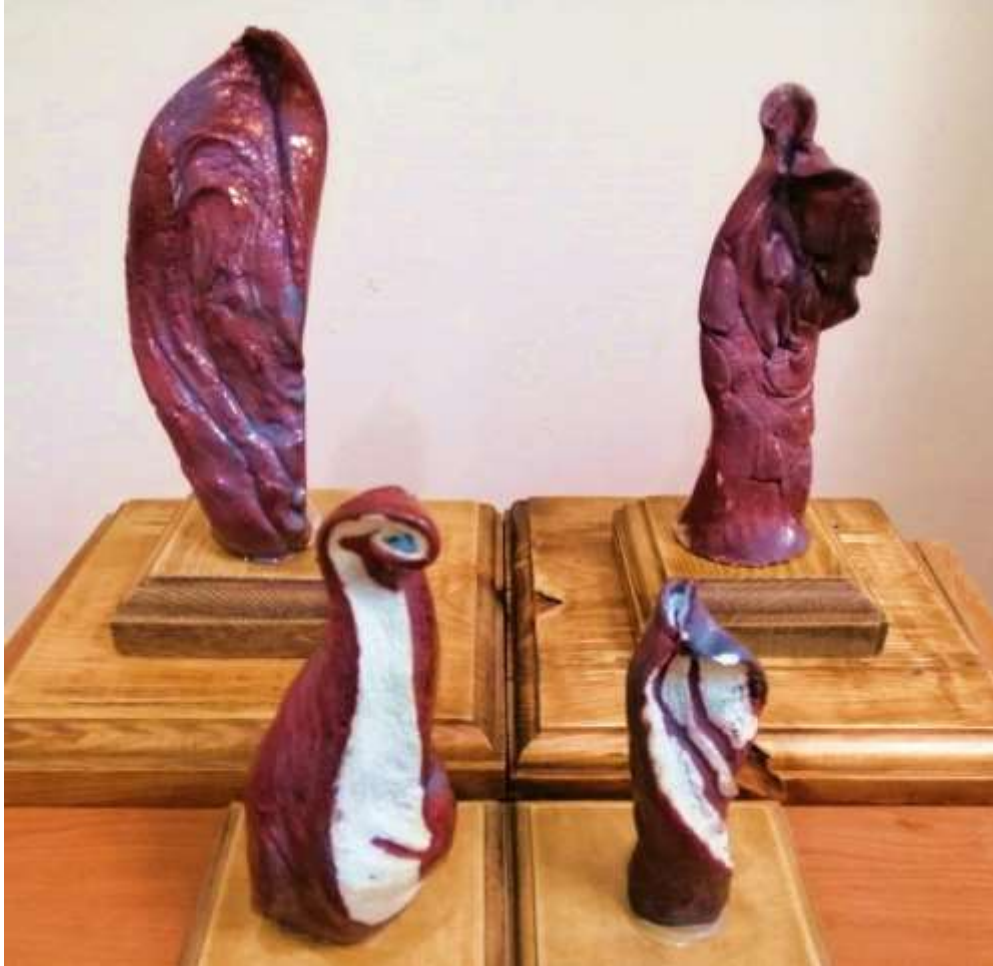
العمل التاسع عدد القطع : 15 قطعة خزفية التقنية : اختزال اكسيد النحاس وكربونات البزموت