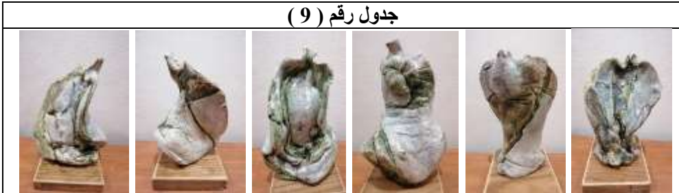
جدول رقم ( 9 )

في هذا العمل نجد القوة التعبيرية لأعمال الخزفية ذات الحركة الظاهرة للأشكال المعبرة عن حالات وأوضاع الشكل الإنساني لتوحي بالتعبير عن حالة الأشخاص وكأنها في حالة شموخ أو انفتاح وبواجهة معبرة عن أوضاع وحركات الجسم الإنساني ، كما تم تغطية السطح بالبطانات الخزفية المزججة بأكسيد النحاس على بطانة بيضاء اللون ، كما اظهرت الملابس السطحية للعمل بعض المعالجات الخطية والكتل كروية الحجم لإحداث تأثيرات جمالية بجانب الألوان المتدرجة للون الأخضر والأزرق الفاتح في تناغم بين المطفي واللامع في بعض اجزاء العمل كما هو واضح في تفاصيل العمل جدول رقم ( 9 ) .