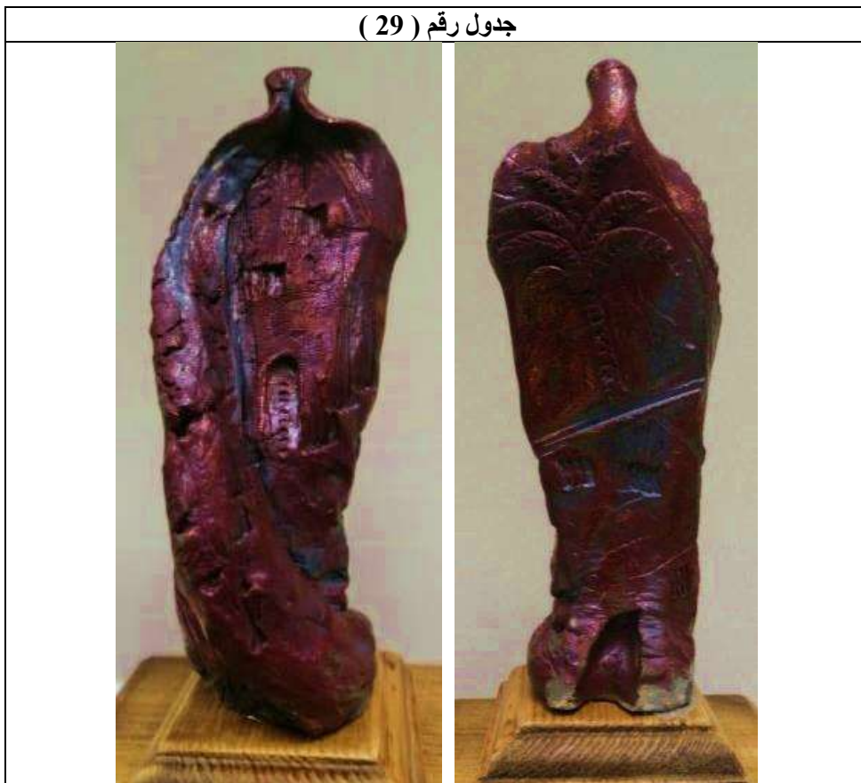
جدول رقم ( 29 )

والقيم مع أنهم متشابهين في المظهر الخارجي ، كما تم تلوينها بلون واحد ليقوم اللون بالربط بين المجموعة حتى تصبح في وحدة واحدة وترابط بصري باللون الأحمر المائل الى اللون " البنفسجي " الذي كان نتيجة عملية الحريق بطريقة الاختزال ، وهذا اللون ناتج عن اختزال اكسيد النحاس مضاف الية كربونات البزموت كما هو واضح في تفاصيل العمل بالجدول رقم ( 29 ) .