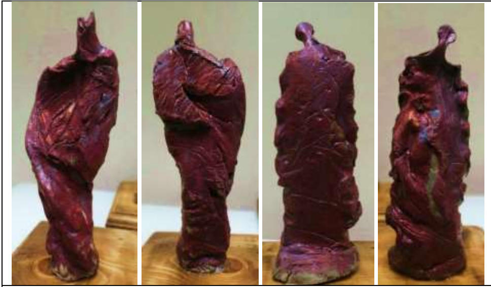
صور تفصيلية من العمل الخامس عشر تتضمن كل القطع من الواجهة الأمامية والخلفية لبعض القطع

وفي نفس السياق تم الاشتراك بمجموعة من أعمال احياءات الحركة في الملتقى الفني الدولي المقام في بيت السناري التابع لمكتبة الإسكندرية بالتعاون مع السفارة البولندية بالقاهرة مع مجموعة من فنانيين دوليين بعنوان " العناصر الأربعة " .