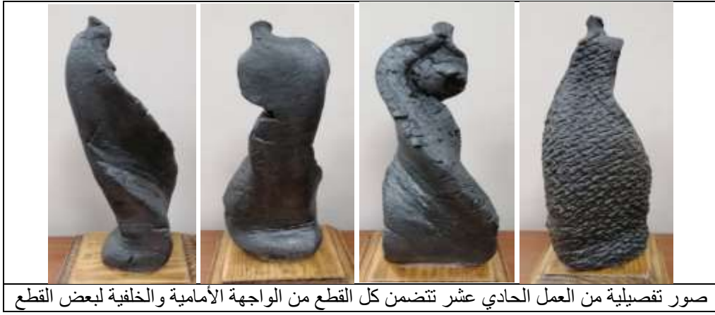
صور تفصيلية من العمل الحادي عشر تتضمن كل القطع من الواجهة الأمامية والخلفية لبعض القطع العمل الثاني عشر :