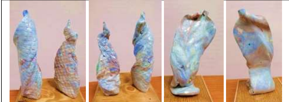
جدول رقم ( 21 )

كما أنه لم يؤثر هذا الطلاء الزجاجي الشفاف على تأثيرات الظلال الناتجة من حركة التشكيل موضحا الحركة الإيحائية لوضع الشكل الإنساني في حركاته الإيحائية التعبيرية عن حالة انفعالية يمارسها الإنسان في أماكن وأوضاع وتحركات مختلفة في حياته اليومية ، كما عكست تداخلات الطينات الملونة احساس الرخام وكأنها قطع تم الحصول عليها من طبقات الأرض ذات التأثيرات اللونية الطبيعية التي تؤكد على الحركة وإيحائاتها التعبيرية لأوضاع الجسم البشري ، وهو ما يتضح من صور الجدول رقم ( 21 ) .