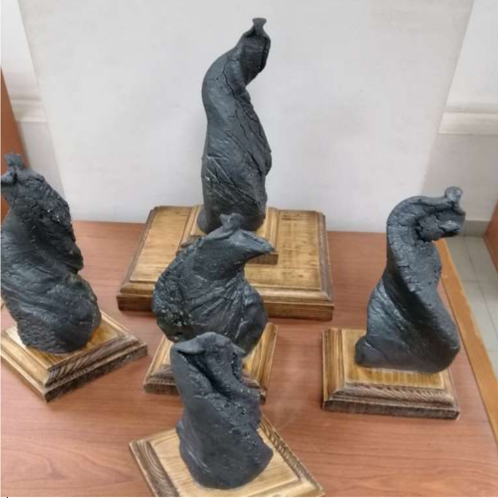
العمل الحادي عشر ، عدد القطع : 5 قطع خزفية التقنية : طلاء زجاجي اسود ( طلاء شفاف + اكسيد حديد + منجنيز +كوبالت )

هذا العمل يعكس في احياء حركة أشكاله الخزفية مجموعة من التعبيرات لحركات الأشخاص في انسيابية تامة وفي أوضاع تشخيصية واضحة لحركات الجسم الإنساني في ظل مجموعة من الملامس السطحية المميزة التي أكدت بوضوح على تعبيرات تلك الحركات ، كما كان للون الأسود " النصف لامع " التي تم تطبيقه على أجزاء هذا العمل اضافة مميزة للسطح حيث أضفى نوع من الفخامة الجادة والقيّمة