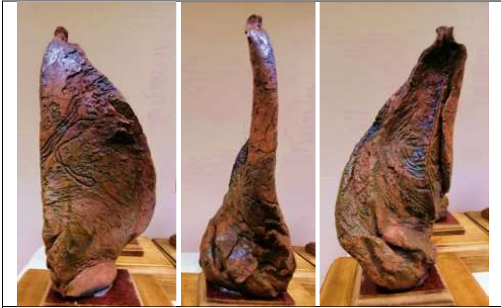
العمل الثالث عشر ، عدد القطع : 13 قطعة خزفية التقنية : الراكو ( جليز شفاف مع أكاسيد : النحاس ، الكروم ، الكوبالت )

هذا العمل يعكس احياءات تعبيرية من حركة اشكاله الخزفية مثل " حلقات الصوفيين " الذين يقومون بالتمايل يميناً ويساراً في " حلقات الذكر " وتختلف كتل اشكالهم وفق حجم اجسامهم وأعمارهم حيث النظام الحركي لإنفعالاتهم ارتفاعاً وانخفاضاً ، كما عكس هذا العمل حركات ملابسهم وكذلك تعبيرات حركات انفعالهم بالذكر دون غيره ، كما جاءت الألوان انعكاساً لهذه الحالة والتي تمت بطريقة حريق "الراكو" الذي اظهر الوان جسم الأشكال الخزفية بالوان متعددة مطفية احياناً وبراقة احياناً أخرى في تناغم منسجم مع الملابس السطحية التي أثرت الاحياءات الحركية التعبيرية للكتل الخزفية كما هو واضح في صور الأعمال بالجدول رقم ( 26 ، 27 )