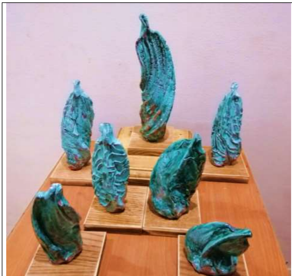
العمل الثاني عدد القطع : 7 قطع خزفية التقنية : طلاء زجاجي بلون الأزرق (التركواز)

لقد جاءت تعبيرات الحركة للكتل الخزفية لجميع الأعمال المنفذة لهذا العمل لتعكس إحياءات لحركات الأشخاص في الطبيعة فنجد العمل الرئيسي وهو يمثل حالة