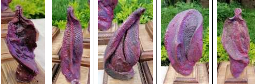
العمل الرابع عشر عدد القطع : 7 قطع خزفية التقنية : اختزال اكسيد النحاس وكربونات البزموت

هذا العمل يعكس فكرة تطور المجتمعات البشرية وكيف تتكون من أجداد وأباء واحفاد فهو باختصار يلخص فكرة تواصل الأجيال وكيف تتم عملية النكاثر البشري وتكون النظام الأسري الذي هو نواة المجتمع فقد تم تنفيذ مجمل هذا العمل ليعطي ابحاث تعبيرية عن الذكر والأنثى والأولاد باختلاف اعمارهم وحركاتهم واحجامهم والخطوط الخارجية التي توحى بهيئاتهم ، ومع اختلاف شخصية كل كتلة نحتية منهم تم انتاجهم بصبغة ملمسية ولونية موحدة حتى يعكس العمل فكرة العائلة ، وان تطور