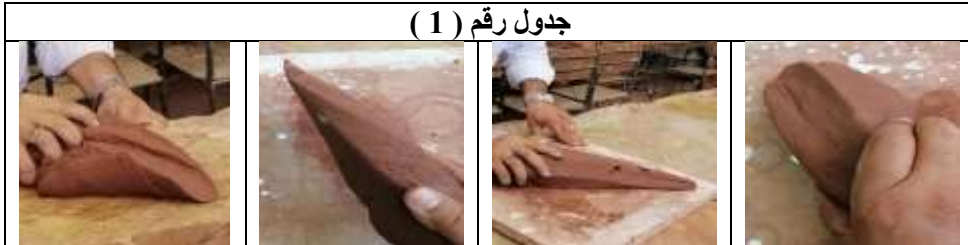
جدول رقم ( 1 )

يتم التشكيل يدوياً بواسطة امساک الكتلة الطينية باليد ثم طرحها على الطاولة عدة مرات مع اللي أثناء الطرح لتعطي عدة ثنيات في سطح الطينة تنشأ عن هذه الثنيات خطوط بمستويات أعلى من سطح الطينة التي غالباً ما تؤثر في عنصر الحركة ، كما تتم عملية الطرح على سطح ناعم أو سطح خشن أو أي سطح له ملمس هذا الملمس سيظهر على سطح الطين بتأثيرات متداخلة أو متراكبة ، بعدها يتم التأكيد على الحركة للوضع الإنساني المراد التعبير عنه والفصل بين الهيئة الشكلية للجسم البشري والرأس التي تميز أهم الملامح الظاهرة للجنس البشري ، كما هو واضح في صور الجدول رقم ( 1 ) .