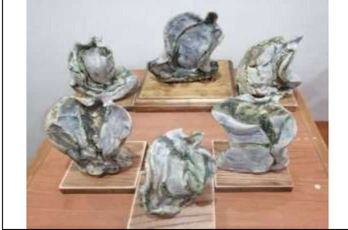
العمل الأول عدد القطع : 6 قطع خزفية ، التقنية : البطانات المزججة

في هذا العمل نجد القوة التعبيرية لأعمال الخزفية ذات الحركة الظاهرة للأشكال المعبرة عن حالات وأوضاع الشكل الإنساني لتوحي بالتعبير عن حالة الأشخاص وكأنها في حالة شموخ أو انفتاح وبواجهة معبرة عن أوضاع وحركات الجسم الإنساني ، كما تم تغطية السطح بالبطانات الخزفية المزججة بأكسيد النحاس على بطانة بيضاء اللون ، كما اظهرت الملابس السطحية للعمل بعض المعالجات الخطية والكتل كروية الحجم لإحداث تأثيرات جمالية بجانب الألوان المتدرجة للون الأخضر والأزرق الفاتح في تناغم بين المطفي واللامع في بعض اجزاء العمل كما هو واضح في تفاصيل العمل جدول رقم ( 9 ) .