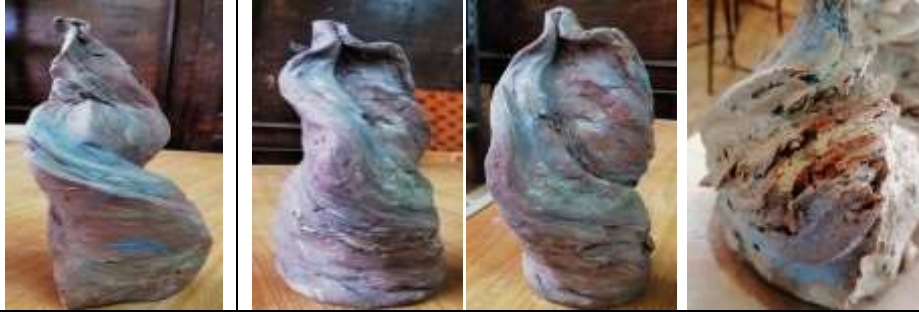
جدول رقم ( 6 ) لون الطينة البيضاء الملونة بعد الحريق