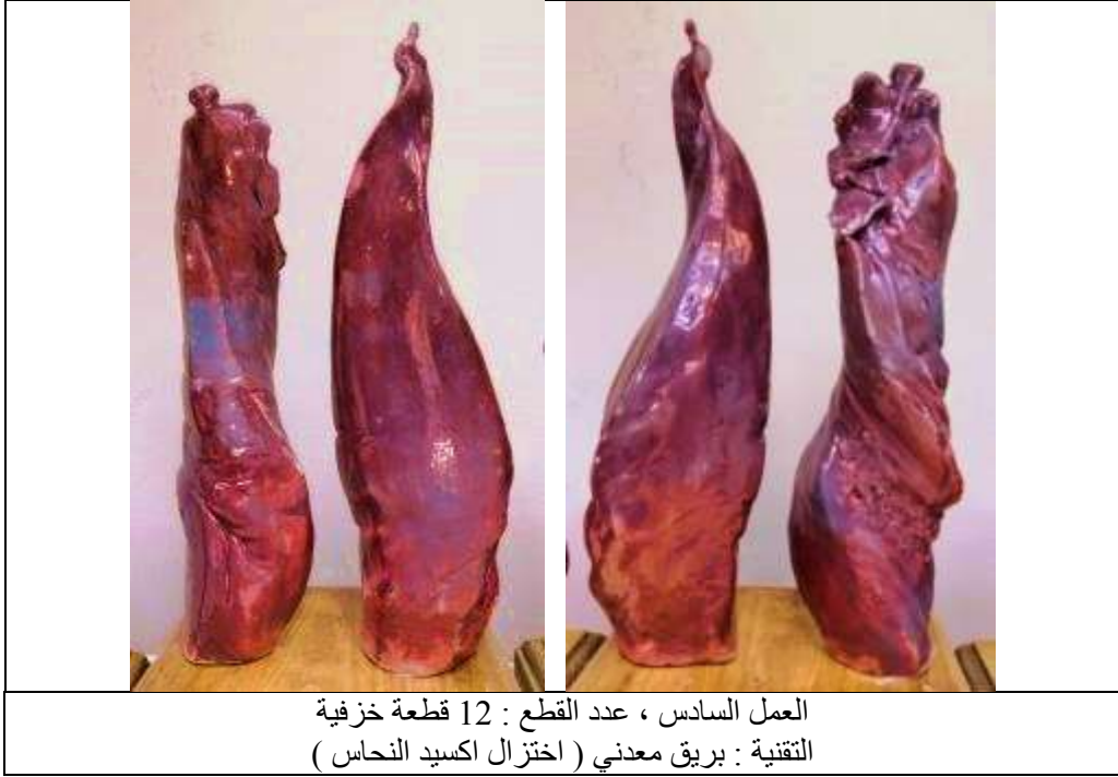
العمل السادس ، عدد القطع : 12 قطعة خزفية التقنية : بريق معدني ( اختزال اكسيد النحاس )

في هذا العمل نجد قوة التعبير الواضحة من الحركة الإيحائية لهذا العمل الذي يعكس في تعبيراته عن الضخامة والفخامة والهبة التي يتصف بها بعض الأشخاص في الطبيعة أو الجماعات اصحاب النفوذ أو الشخصيات العامة التي يكون لها هيبتها وشموخها وعظمتها ، كل هذه التعبيرات واضحة تماماً من هيئة حركات هذه الكتل الخزفية المعبرة ، كما جاءت الألوان الخزفية معبرة بشدة عن ذلك فنجد اللون الأحمر النحاسي ذو البريق المعدني وهو لون يدعو للفخامة وهو لون لامع براق يساعد الحركة في توصيل تعبيراتها بسهولة واتقان ووضوح كما يتضح ذلك كله من رؤية تفاصيل حركات الأعمال الموضحة في صور الأشكال الواردة في الجدول رقم ( 15 ، 16 ) .