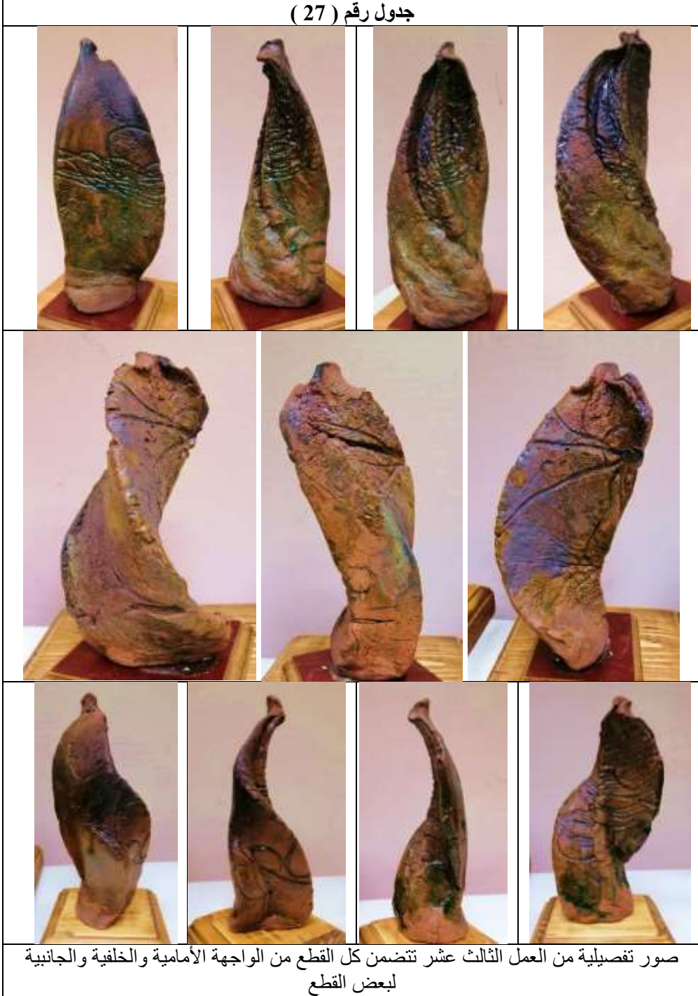
جدول رقم ( 27 )