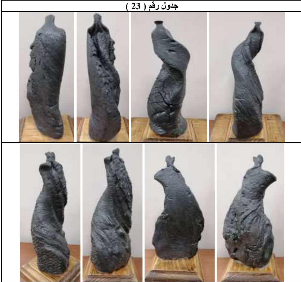
جدول رقم ( 23 )

لقد تم طلاء مجموعة القطع الخزفية لهذا العمل العاشر بطلاء زجاجي شفاف مضاف اليه اكسيد الحديد والمنجنيز والكوبالت مع اضافة مواد عتامه لكي يظهر اللون الأسود بهذا الجمال الذي يؤكد على القيم الجمالية لعنصر الحركة وكذلك الملامس الموجودة على السطح مما يعطي احياءات تعبيرية كثيرة نراها في تفاصيل الصور الموجودة للأعمال في الجدول رقم ( 23 ) .