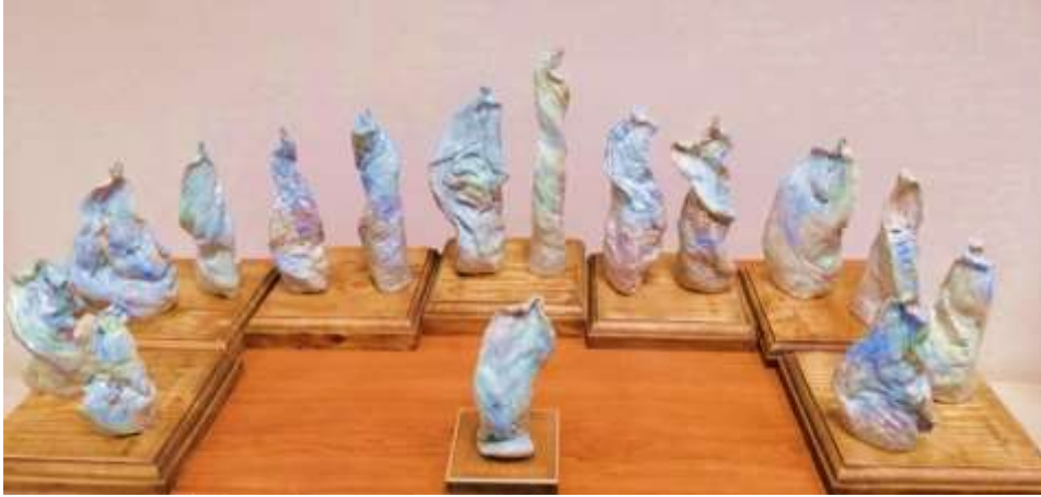
جدول رقم ( 20 )