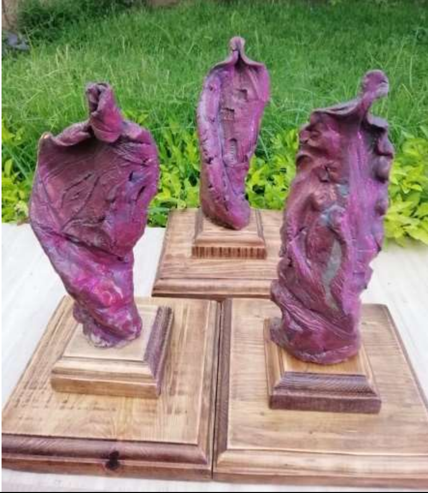
العمل الخامس عشر ، عدد القطع : 3 قطع خزفية التقنية : اختزال اكسيد النحاس

هذا العمل يتكون من 3 قطع خزفية تم تشكيلها بالكتلة الطينية وايحاءات الحركة توضح تعدد الهيئة الخارجية للشكل وفق تعدد هيئات الشكل الإنساني كما توضح الملابس السطحية للشكل الخزفي التفرد والتميز لكل شكل مختلف عن الآخر من حيث الثنّيات والمستويات التي جعلت لكل عمل شخصيته الخاصة به مثله كمثل شخصيات الجنس البشري تختلف بعضها عن بعض في الطباع والعادات والسلوك