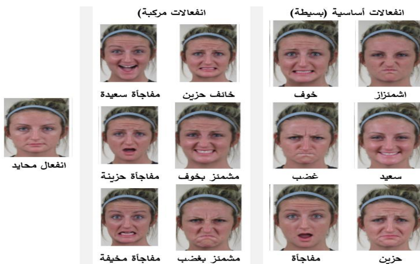
شكل (٢) الانفعالات المستخدمة بالتجربة