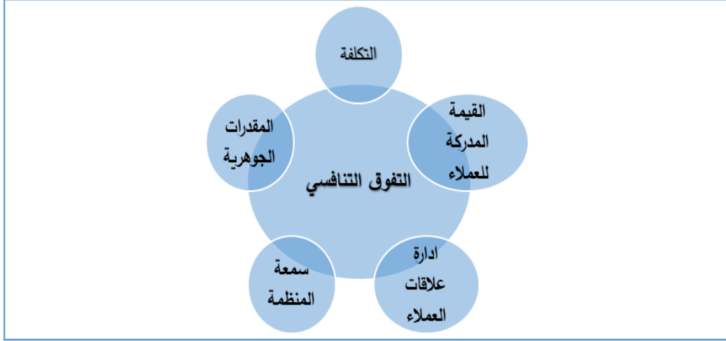
شكل رقم ٢: أبعاد التفوق التنافسي

وفيما يلي شكل توضيحي (٢) يوضح أبعاد التفوق التنافسي.