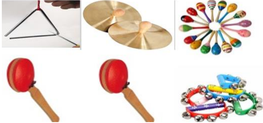
شكل رقم (١) يوضح الالات الايقاعية المستخدمة في البرنامج التدريبي