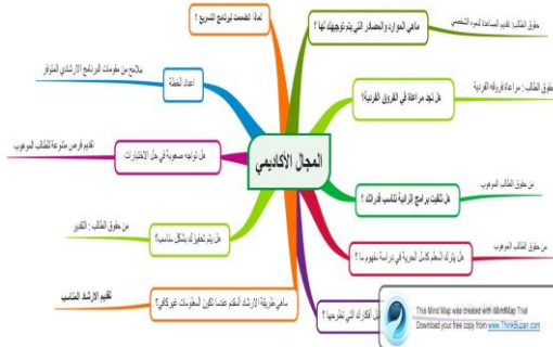
شكل (١): مخطط الترميزات (Code) والموضوعات (Theme) التي تتعلق بالمجال الأكاديمي

من خلال الاطلاع على ماورد في الإجابات التي نتجت عن المقابلات قامت الباحثة باستخراج مجموعة من الترميزات (Code) والموضوعات (Theme) التي تتعلق بالمجال الأكاديمي وتتمثل في المخطط التالي: