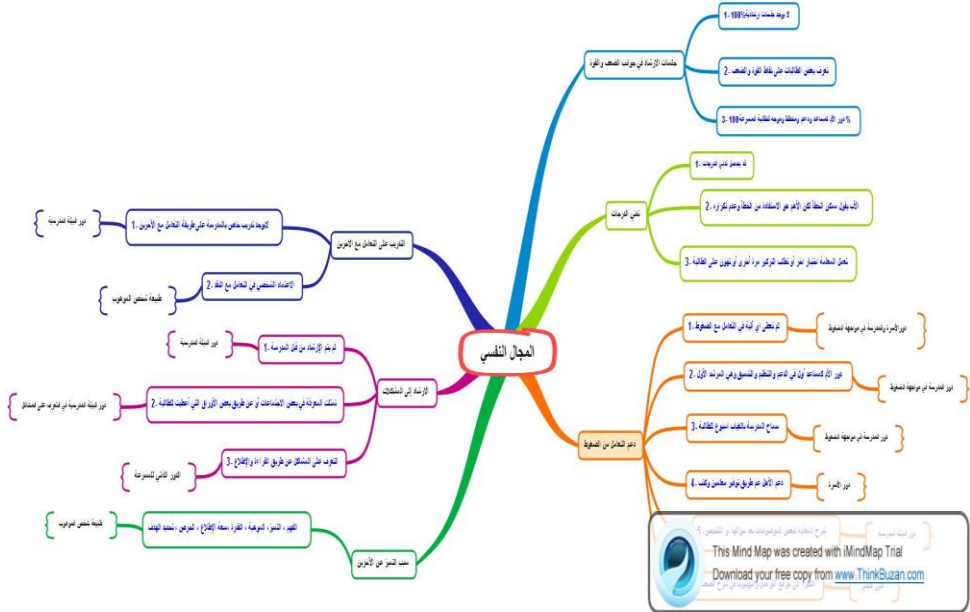
شكل ( ٢ ) : مخطط الترميزات (Code) و الموضوعات (Theme) التي تتعلق بالمجال النفسي

من خلال الاطلاع على ماورد في الإجابات التي نتجت عن المقابلات قامت الباحثة باستخراج مجموعة من الترميزات (Code) والموضوعات (Theme) التي تتعلق بالمجال النفسي وتتمثل في المخطط التالي: