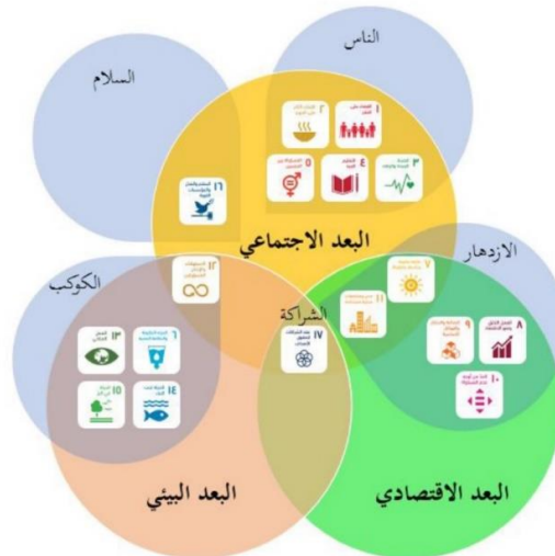
شكل ٣: التكامل بين الأبعاد والمحاور الرئيسية للتنمية المستدامة وأهدافها [15]