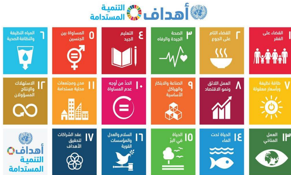
شكل ٢: أهداف التنمية المستدامة [11]

في عام ٢٠١٥، وافقت الدول الأعضاء في الأمم المتحدة على القرار رقم ٧٠/١ الخاص بإعلان أهداف التنمية المستدامة تحت عنوان "تحويل عالمنا: خطة التنمية المستدامة لعام ٢٠٣٠" وتضم ١٧ هدفاً و١٦٩ مؤشراً وهي بمثابة دعوة عالمية للعمل من أجل القضاء على الفقر وحماية الكوكب وضمان تمتع جميع الناس بالسلام والرخاء. وتمتد الأهداف السبعة عشر الموضحة في الشكل (٢) إلى جميع الدول والقضايا الرئيسية المعاصرة الحاسمة ذات الصلة بالمستقبل الحضري والإقليمي وتدرج أجندة التنمية المستدامة ٢٠٣٠ أن التعامل والتدخلات في أحد المجالات سيؤثر إيجاباً أو سلباً على النتائج في باقي المجالات الأخرى [11]. وتعد هذه الخطة امتداداً للأهداف الإنمائية للألفية التي تم اعتمادها في عام ٢٠٠٠. وتدرج هذه الأهداف أن القضاء على الفقر يجب أن يتم جنباً على جنب مع الحلول والاستراتيجيات الخاصة بالنمو الاقتصادي وتتصدى في نفس الوقت لمعالجة تغيرات المناخ وحماية البيئة وغيرها من الموضوعات والقضايا التنموية ذات الصلة [12]، لذا يجب على جميع الدول وأصحاب المصلحة وصناع القرار اتباع هذه الخطة لضمان تحقيق حياة مستدامة وعالم أفضل بحلول عام ٢٠٣٠، وتهيئة الفرص للجميع والحد من أوجه عدم المساواة، ورفع مستويات المعيشة الأساسية، وتدعيم الاندماج والشمول والعدالة الاجتماعية، وتعزيز الاستدامة البيئية للموارد والنظم الطبيعية والإيكولوجية على نحو متكامل مستدام.