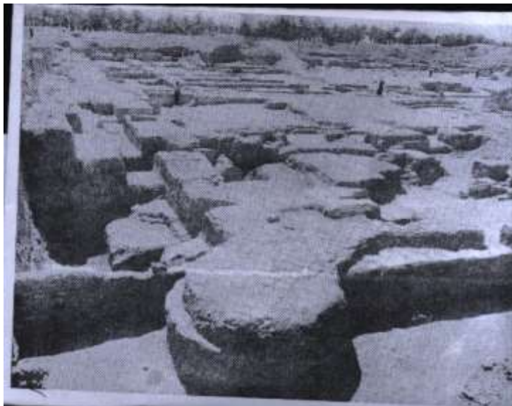
ملحق ٤- بقايا اثار اسس مدينة الكوفة القديمة تظهر استخدام مادة الطين