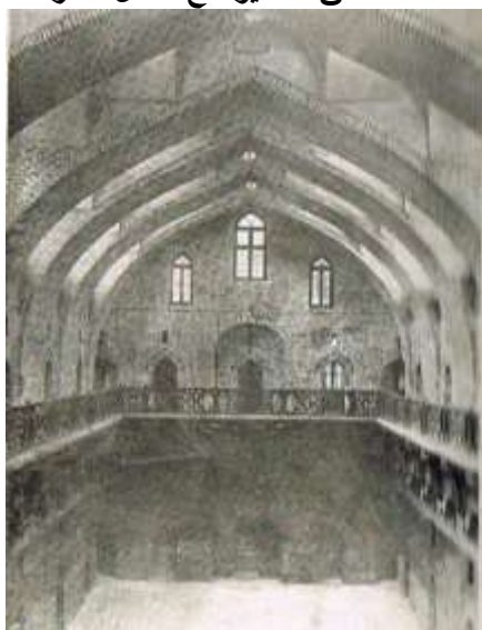
ملحق ٨ مدينة حربي الاسلامية