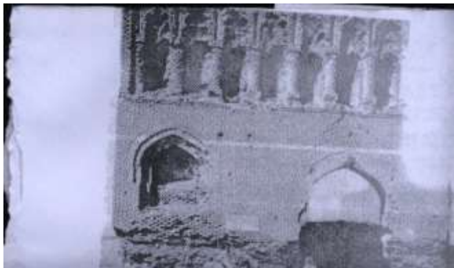
ملحق ٩ باب بغداد في مدينة الرقة يوضح استخدام اللبن