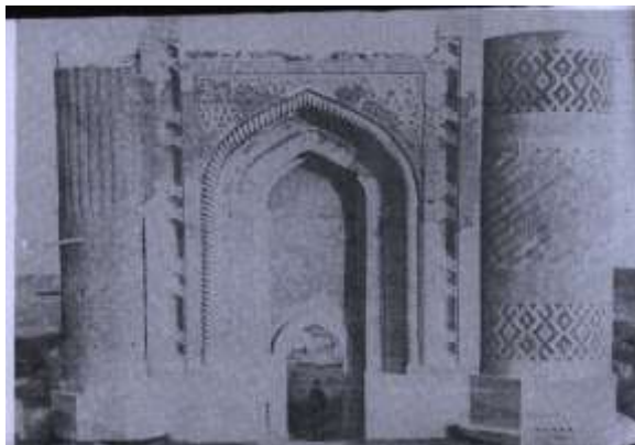
ملحق ٢ يوضح واجهة المنارتان للمدرسة الشرايية في واسط