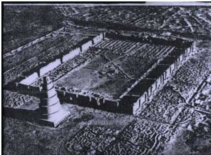
ملحق ١٠ - مسجد الملوية - سامراء