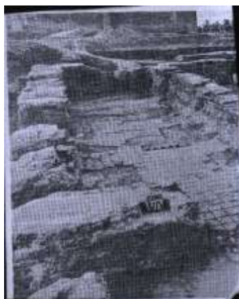
ملحق ٣- بقايا جدران دار الامارة في الكوفة يوضح استخدام الطابوق الفرشي في تبليط الارضيات