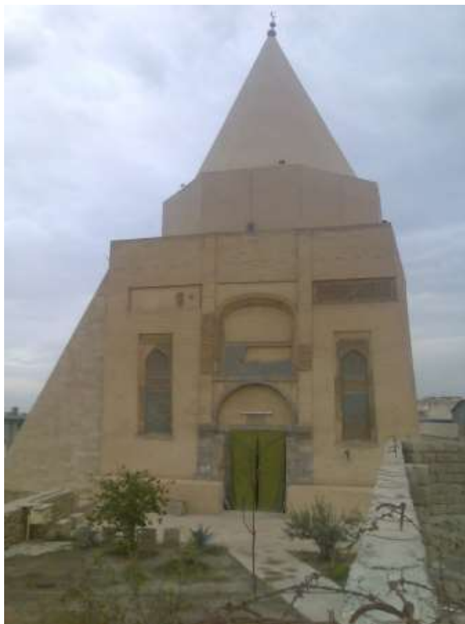
ملحق ١١- ضريح للامام يحيى ابوالقاسم على ضفاف دجلة في مدينة الموصل العصور العباسية المتأخرة مبنى من اللبن