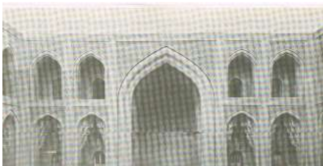
ملحق ٦ القصر العباسي في بغداد مبنى بالاجر