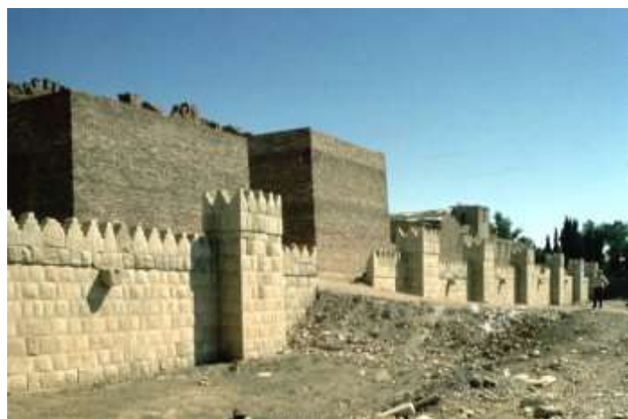
ملحق ١ اسوار نينوى مبنية من الحجر ومادة اللبن

-يوسف ، شريف ، تاريخ العمارة العراقية في مختلف العصور ، ط ١ ، مطبعة وزارة الثقافة والإعلام ، (بغداد و بلا)