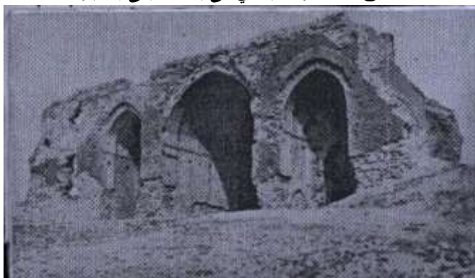
ملحق ٧ - يوضح مدخل قصر الخليفة او دار العامة - سامراء