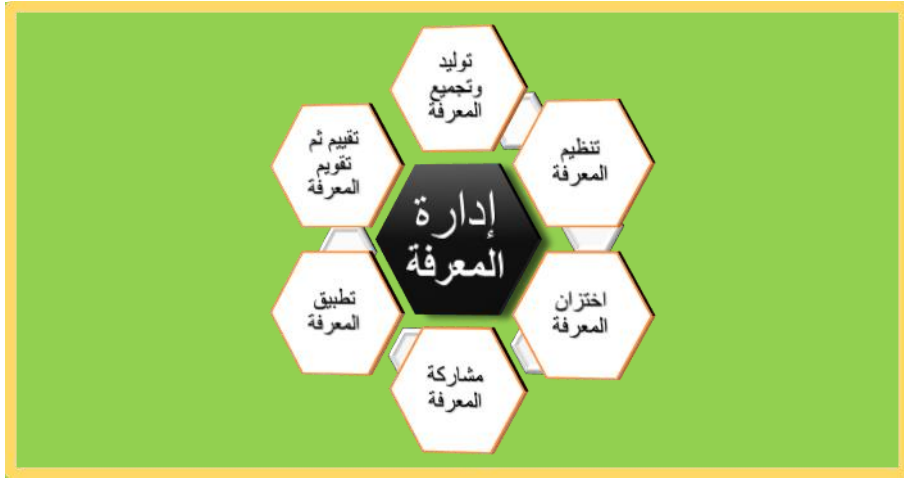
Figure 6: عمليات إدارة المعرفة