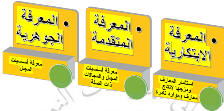
Figure 5: أنواع المعرفة