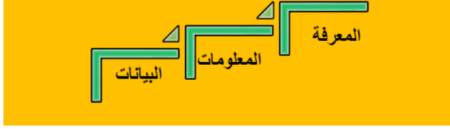
Figure 4: مراحل نمو المعرفة

- ومن هنا يمكن أن نعتبر أن المعرفة كغيرها تمر بمراحل نمو تسهم في تحسين جودتها كلما ارتفعنا سُلماً، ففي البداية تكن مجموعة رموز مرئية، مسموعة، وسمعبصرية مُجردة من المعنى يتم استخدام بعض البرمجيات؛ لنتحول إلى معلومات، ثم بعد ذلك ندخل على أعلى القمة وهي المعرفة والتي يتم استخدام برمجيات أشد تعقيداً لتظهر في ثوب جديد ممزوج بسنوات التطبيق والممارسة وهي التي يتم الاعتماد عليها لتحسين الأداء ولوصول لزهو الأمور.