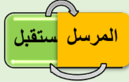
Figure 7: أطراف مشاركة المعرفة

وأرى أن هذين الدورين يحدثان بشكل تبادلي ديناميكي بين جميع أخصائي المكتبات باستخدام وسيلة اتصال مناسبة حيث أن مَنْ يمنح تجاربه ومعارفه في مرة يأتي المرة التالية لها ويكون هو المُتلقّي وهذه هي الحياة متغيره بين أخذٍ وعطاءٍ.