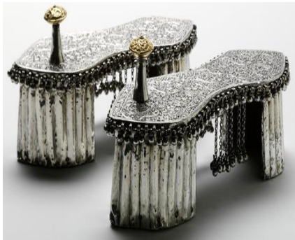
(لوحة ١٧) بادوكا إحتفالية مكفتة بصفاتح من الفضة تنسب إلي الهند، على الأرجح راجستان، أو زنجبار، من القرن ١٢ هـ-١٣ هـ / إلى ١٨م-١٩م) محفوظ في متحف (Michael Backman Ltd).

https://www.michaelbackmanltd.com/object/ceremonial-gold-silver-paduka-sandals/