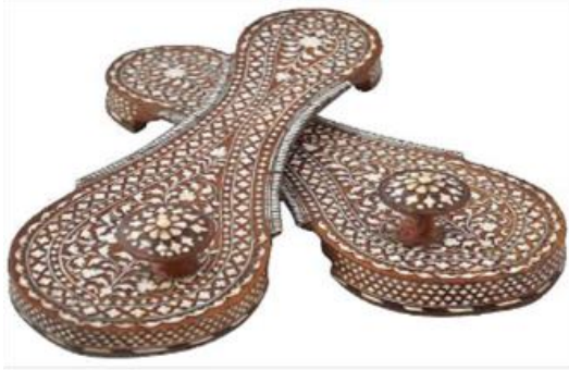
(لوحة ٢٧) بادوكا خشبية مرصعة بالعظم والعاج تنسب إلي

https://www.chiswickauctions.co.uk/auction/lot/lot-196--a-pair-of-brass-inlaid-toe-knob-wooden-paduka-sandals/?lot=123351&so=4&st=paduka&sto=0&au=&ef=&et=&ic=False&sd=1&pp=48&pn=1&g=1