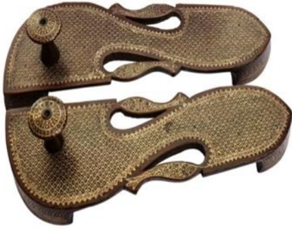
(لوحة ٢٥) زوج من البادوكا الخشبية ينسب إلي راجستان شمال

غرب الهند أواخرالقرن(١٣هـ / ١٩م) أوائل القرن(١٤هـ / ٢٠م)