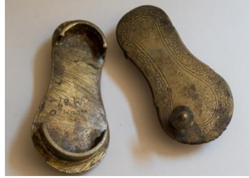
(لوحة ١٩) بادوكا من معدن النحاس الأصفر محفوظة في متحف جاير أندرسون بالقاهرة يرجح نسبتها إلي الهند في فترة القرن (١٣هـ/ ١٩م) (تنشر لأول مرة) رقم الحفظ ١٥٥٧