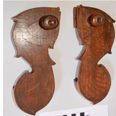
(لوحة ٢٢) بادوكا خشبية علي شكل سمكة، يرجح نسبتها إلي الهند أو البنغال في القرن (١٣هـ/ ١٩م)، وهي محفوظة بمتحف جاير أندرسون بالقاهرة، رقم الحفظ ١٧٠٠