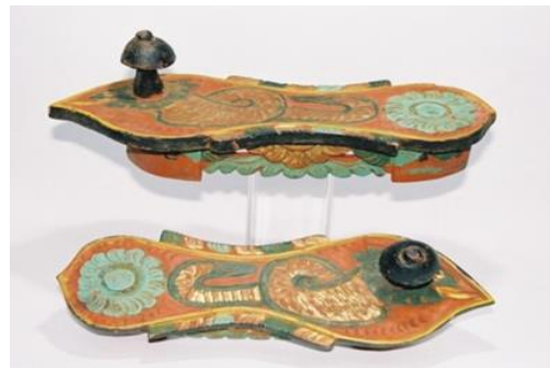
(لوحة ٢٨) بادوكا من الخشب مزخرفة بزخارف منحوتة