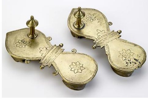
(لوحة ١٨) بادوكا مصنوعة من النحاس تنسب إلي القرن (١٤هـ/ ٢٠م) محفوظة في متحف باتا