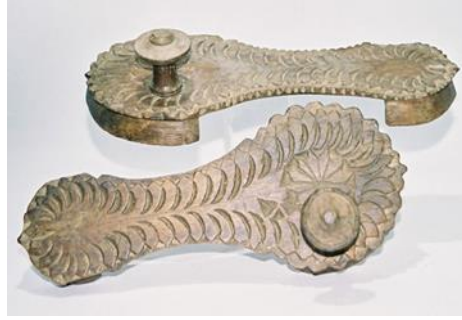
(لوحة ٣١) بادوكا خشبية تنسب إلى الهند، هيماشال براديش منتصف القرن (١٣هـ/ ١٩م)

محفوظ بمتحف (shoes or no shoes). رقم الحفظ 389