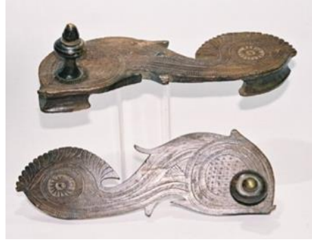
(لوحة ٢٤) بادوكا خشبية علي شكل سمكة تنسب إلي