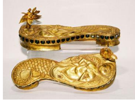
(لوحة ١٢) بادوكا خشبية مكفتة بالذهب ومرصعة بالأحجار الكريمة تنسب إلى الهند أواخر القرن (١٣/هـ/١٩ م) محفوظ بمتحف (shoes or no shoes) رقم الحفظ ١٣٦٥

https://www.michaelbackmanltd.com/object/pair-of-silver-paduka-sandals/