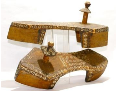
(لوحة ٢٩) بادوكا خشبية للسيدات ملونة تنسب إلي عمان أوائل

https://www.michaelbackmanltd.com/archived_objects/hoshiapur-ivory-paduka-shoes/