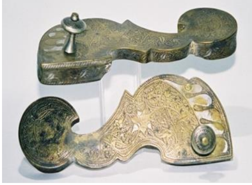
(لوحة ٢٠) بادوكا من معدن النحاس الأصفر والفضة و تنسب إلي باكستان لاهور منتصف القرن (١٣هـ/ ١٩م) محفوظ بمتحف (shoes or no shoes) رقم الحفظ ٧٣١