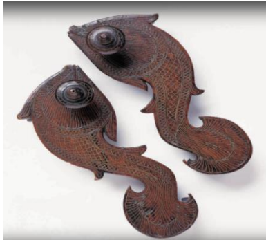
(لوحة ٢٣) بادوكا خشبية علي شكل سمكة مزخرفة بالنحاس تنسب إلي جنوب البنغال بالهند القرن (١٤هـ/ ٢٠م) ، محفوظة في متحف باتا