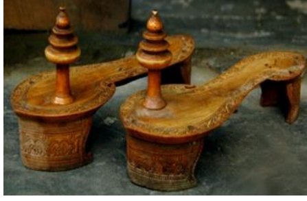
(لوحة ٣٠) بادوكا خشبية تنسب إلى الهند، ومن المرجح نسبه هذه البادوكا إلى القرن (١٣-١٤هـ/ ١٩-٢٠م)