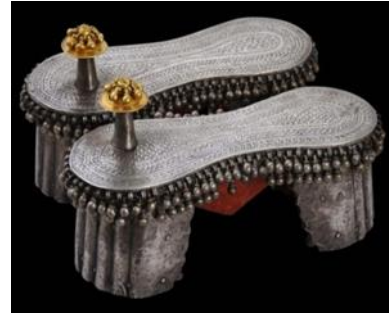
(لوحة ١٦) بادوكا أثرية من الفضة والذهب للزفاف يرجح نسبتها للهند من القرن (١٣/هـ/١٩م) معروضة في متحف فيكتوريا وألبرت، لندن

https://www.michaelbackmanltd.com/object/ceremonial-gold-silver-paduka-sandals/