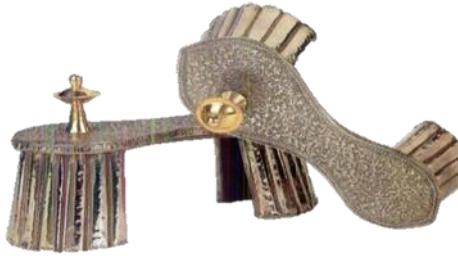
(لوحة ١٤-١٥) زوج من البادوكا الفضي، ذو مقبض علي هيئة الصينية مذهب، ويعود إلى جايبور بالهند، القرن (١٢/هـ/١٨م) ومحفوظ في متحف باتا.

ALEXANDER MCLVER, J., & COLLINS, W., All about Shoes, 27. JaiN-NEUBAUER, J., & Footwear in Indian Culture, 6.