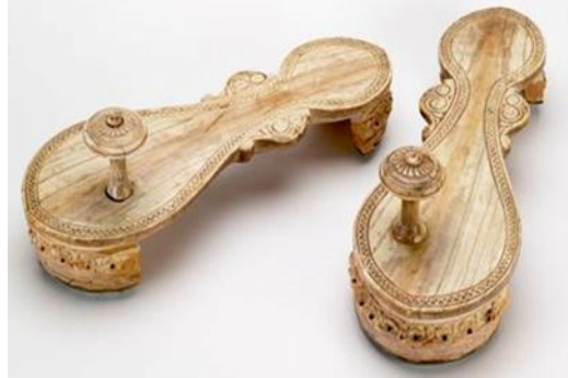
(لوحة ٢١) بادوكا من العاج تنسب للقرن (١١هـ/ ١٧م) محفوظة في متحف باتا