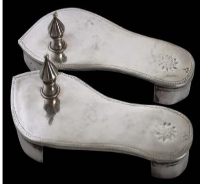
(لوحة ١٣) بادوكا مصنوعة من الفضة محفوظ في متحف (Michael Backman Ltd) تنسب إلي الهند، ربما ولاية غوجارات أواخر القرن (١٢/هـ/١٨م)، وأوائل القرن (١٣/هـ/١٩م)

https://www.michaelbackmanltd.com/object/pair-of-silver-paduka-sandals/