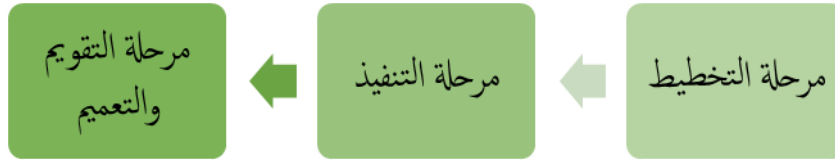
شكل (٣) مراحل التصور المقترح