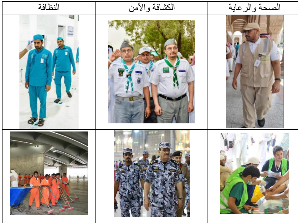
جدول 1. بعض أزياء القوى العاملة في موسم الحج

من جدول (1) يتّضح لنا أنّ كلّ فئة لها زيّ معين يعبر عن الوظيفة التي ينتمي لها، ولكنها لا تغطّي المتطلبات الوظيفية الحقيقية التي يجب أن تتوفر في زيّ كل فئة، كما لا تتوفر كامل القطع من قبعة وسترة وحزام وقناع وحذاء لكل فئة. فنجد أن القبعات مجرد رموز لا تعطي الحماية اللازمة من الإجهاد الحراري، كما نجد أن السترات أو الصديري مجرد أشرطة فلورية عاكسة وتحمل شعار الجهة وقد تحتوي على جيوب، كما أن الأحذية لا تحقق الراحة والأمان وخاصة لعمال النظافة، وكذلك القفازات غير متوفرة أو متوفرة عند البعض، مع عدم ارتداء الأقفعة للحماية من الأتربة والغبار والحرارة. وجاءت نتائج استطلاع الرأي للقوى العاملة حاجتهم إلى القطع الملبسية التالية كما في مخطط (1)