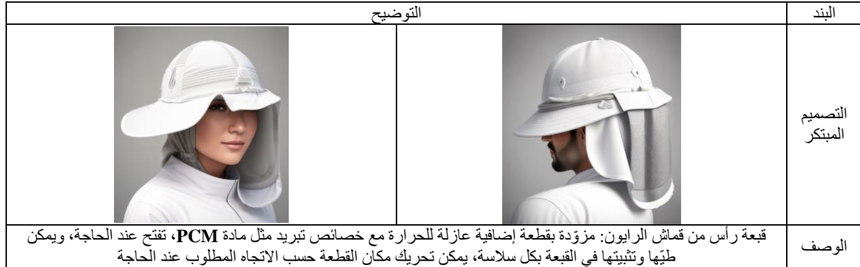
جدول 2. الحلول التصميمية لأزياء القوى العاملة المقترحة

وتوصّلت الباحثات إلى وضع التصميمات التالية كما في الجدول رقم (2)، وتم الاستعانة بتقنية الذكاء الاصطناعي عبر موقع (https://www.newarc.ai) بحيث يتم رفع الرسم التخطيطي للباحثات في الموقع مع كتابة الوصف والمقترحات التطويرية للقطعة ثم توليدها كنموذج ثلاثي الأبعاد بالذكاء الاصطناعي.