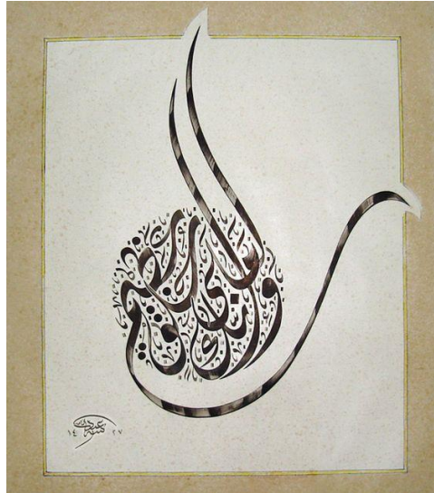
شكل (3) للفنان (عبد الناصر) يوضح تحقق الحركة بقوة نتيجة ارتباط الخط المائل بالخط المنحني

وعند ارتباط الخط المائل مع الخط المنحني معاً تظهر الحركة بشكل قوى وهذا ما تمثله البنية الشكلية التجريدية لحروف خط الديواني الجلي شكل (3).