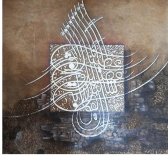
شكل(7) لوحه: إنا أعطيناك الكوثر للفنان (حسن طه) اكريلك علي خشب 60mdf في 60سم

https://pijad.journals.ekb.eg/article_353296.html?lang=ar