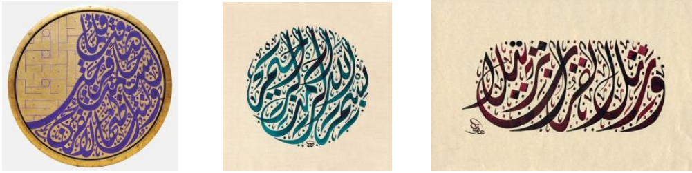
شكل (4) - (أ- ب- ج) للفنان (عدي) يوضح بعض أنواع الصياغات المختلفة للخط الديواني الجلي

اتجاهات جديدة في الفكر التنظيمي، السلمي، (2001م)، ص ٧٣ . " حيث تحمل الحروف قيم فنية تتصل بتشكيلاتها ونظم اتصالها وانفصالها ، وما تحمل من قيم تعبيرية ويعطى انطباعات بالحركة والتراقص مما يؤكد دعم إمكانيات الخط العربي، كعنصر فن تشكيلي ." جماليات الخط العربي وتطبيقاتها المعاصرة، رشاد، (2014م)، ص ٢٥ . " إن بعض التصميمات الخطية تبدو متحركة حيث تذهب خطوطها باتجاهات متعكسة وتفجر مجموعة الخطوط المستقبلية والمنحنية بكل الاتجاهات منطقة نواة متشابكة من الحروف، وهناك تصميمات أخرى تبدو حركتها من طريقة واتجاه قراءة النص نفسه، حيث تتحرك العين صعوداً وهبوطاً ، وتدور لتتبع كل حرف من حروفه ، وكيفية تداخل بعضها ببعض مما يغير مراكز اللوحة باستمرار فيوحي بالحركة وهو ساكن والفنانين جميعاً يحاولون الوصول لحركة كامنة (تقديرية) داخل الحروف وداخل التصميم العام بأساليب مختلفة . " شكل (3) ، فوزى (٢٠٢١م)، ص ١١٠ . إن صياغة حروف وكلمات التصميم الخطي على مستوى (مسار) أفقى بين خطين شكل (4-أ)، أو داخل شكل دائري شكل (4-ب)، أو جزء من الشكل الدائري شكل(4-ج)، يعطي الحركة داخل هذا المستوى الأفقى أو الشكل الدائري.