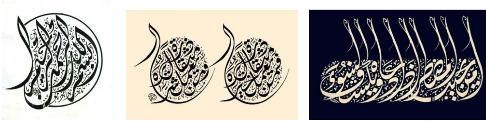
شكل (5) - (أ، ب، ج) للفنان (البناني) يوضح تحقق الحركة بالخروج عن هيكل التصميم لحروف خط الديواني الجلي

بينما إذا تجاوز التصميم الخطي هذا الإطار (الهيكل) في بعض أجزائه بخروج بعض الحروف منه ، أثار طاقة حركية أقوى في المستوى. شكل (5) - (أ، ب، ج)