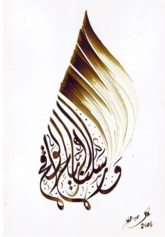
شكل (9)، لوحة: آية قرآنية، للفنان (كمال عبد القادر) أحبار ملونة علي ورق -مقاس غير معلوم

https://pijad.journals.ekb.eg/article_353296.html?lang=ar