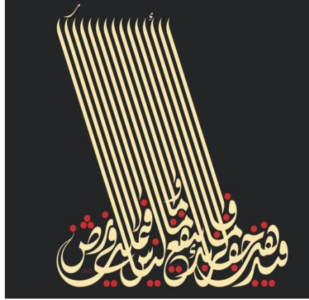
شكل (8)، لوحة آية قرآنية، للفنان (منير الشعراي) فن جرافيك علي ورق

https://pijad.journals.ekb.eg/article_353296.html?lang=ar