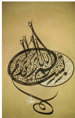
شكل (10)، لوحة: البسمة، للفنان (محمد مظفر) حبر علي ورق مقهر-مقاس غير معلوم

يتضح الإحساس بالحركة داخل العمل من خلال الاتجاه المنحني الحلزوني الناتج عن توزيع الحروف والكلمات من خلال بناء تصميمي نتج عنه إيقاع ( متناقص - متزايد ) ناتج عن تكرار الحروف والكلمات محققاً قيمة جمالية، ونتج عن ارتباط الخط المائل مع الخط المنحني معاً ظهور الحركة بشكل قوى محققاً الوحدة في العمل الفني ، كما تحقق الاتزان داخل التكوين الخطي للعمل من خلال محاور أفقية ورأسية.