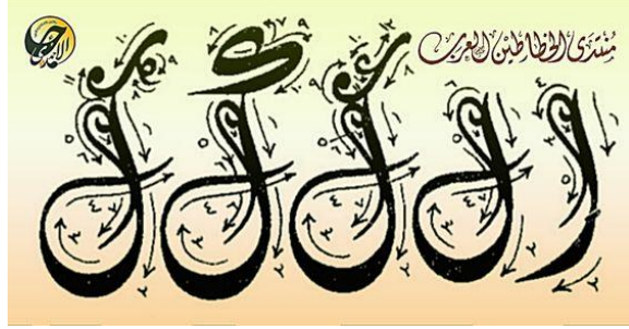
شكل (2) - (أ- ب) يوضح أنواع الخط الهندسي لحروف خط الديواني الجلي

وعند ارتباط الخط المائل مع الخط المنحني معاً تظهر الحركة بشكل قوى وهذا ما تمثله البنية الشكلية التجريدية لحروف خط الديواني الجلي شكل (3).