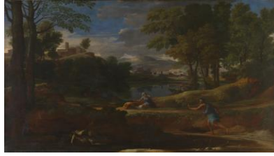
١٦٤٨٠ Nicolas Poussin · a Man killed by a Snake Oil on canvas cm ١٩٧,٨ × ١١٨,٢

فى اللوحة نجد موضوعاً يدور حول أصابة رجل من قبل ثعبان، وورقد ميتاً بجانب بركة، يبدو الرجل وكأنه أعرج، وجلده رمادي مخضر. الطريقة التي يتم بها بناء المشهد تكشف الدراما على عدة مراحل حيث يرى الرجل الذي يركض الرجل الميت والثعبان، والمرأة لا ترى سوى الرجل الهارب، والصيد من بعيد يراها فقط. تُستخدم الأشجار لتأكيد الحركة والوضع المتعرج للأشخاص في المناظر الطبيعية والمناطق المتناوبة من الضوء والظل تقود أعيننا إلى عمق المسافة. من المحتمل أن يكون هذا المشهد مستوحى من منطقة فوندي المليئة بالثعابين، جنوب شرق روما، والتي ربما زارها بوسان ومالك اللوحة جان بوينتيل Jean Pointel. قد يعتمد الموضوع على حدث فعلي سمع عنه بوسان أو شاهده. نستنتج من تلك اللوحة أحد مبادئ حكرة التنوير ذات التأثير على أفكار بوسان وتناوله لهذا المشهد والتي تدور حول معرفة الحقيقة وكيف يمكن عند تناقل المعلومة أن يتم تغييرها ويبعدها عن أصلها، حيث يدعو هذا المبدأ إلى ضرورة البحث عن الحقيقة وعدم التسليم بما ينقل إلينا وذلك لتفادي ما قد يحدث من اختلاف بين ما هو حقيقي وبين ما قد نقل بالفعل و ذلك لتفادي أخطاء السابقين وعدم اعتبارها كمسلمات و البناء عليها. ونستنتج أيضاً من استخدام نيكولا بوسان للعنصر البشرى كجزء من المنظر الخلوي وليس مركزاً له، مفهوم أن الإنسان جزء من الكون وليس محوره و الأشجار والأنهار و كل عناصر الطبيعة لا نقل أهمية عن العنصر البشري في هذا الكون.