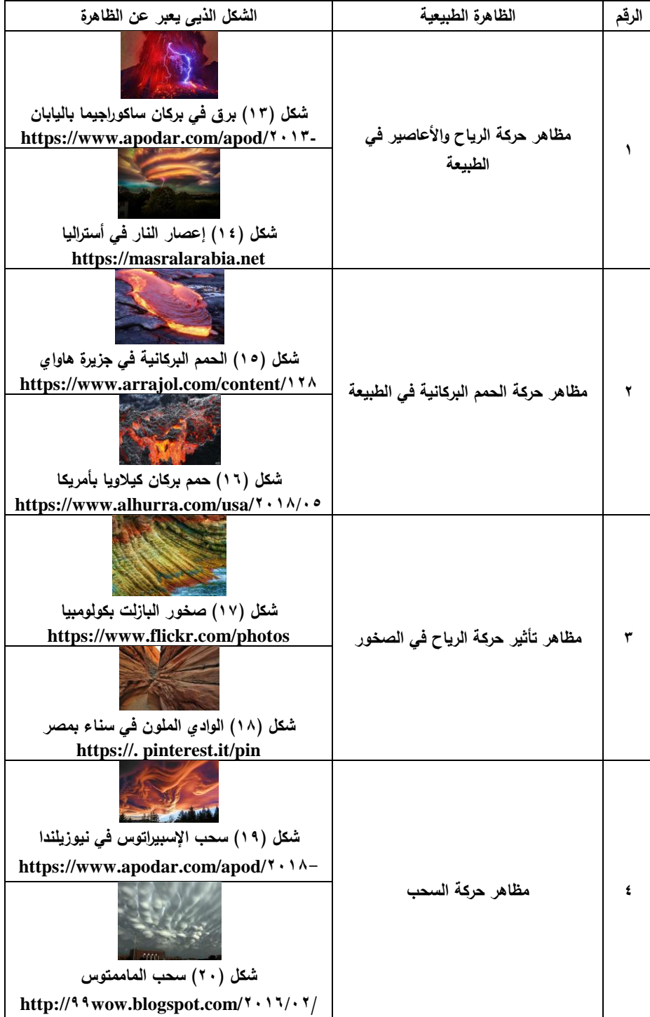
جدول رقم (٢) يوضح بعض الظواهر الطبيعية (من إعداد الباحث)