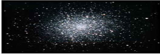
شكل رقم (١) تجمعات نجمية توضح عنصر النقطة

إن الفراغ في التصميمات يطلق عليه اصطلاحياً لفظ الأرضية، وتتباين مظاهره وفاعليته تبعاً لكيفيات توظيف الأشكال فيبدو أحياناً كأرضية مسطحة تحيط بالأشكال وأحياناً أخرى يبدو كفراغات تحتويها الأشكال.