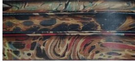
شكل (١١) مجموعة كتب مطبق على جوانبها فن الترخيم مكتبة الكتب النادرة بالجامعة الأمريكية

سعى الكثير من الفنانين لدراسة فن الترخيم ومعرفة طريقة تطبيقه حيث أن هذا الفن كان له سرية كبيرة نظراً لاستخدامه في الأوراق المهمة والسجلات السياسية الهامة وغيرها، كما في شكل (١١)، ولقد نفذ فن الترخيم على أغلفة الكتب القيمة قديماً في معظم أنحاء العالم وحالياً يتم ترميم الكتب النادرة بهذا الفن الراقي كما في شكل (١٢).