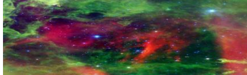
شكل رقم (٢) سديم الوردية يوضح عنصر اللون

http://www.jpl.nasa.gov/spaceimages/details.php?id=PIA09267