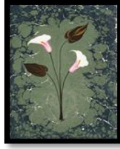
شكل رقم (٢٨) المهرجان

Dumupinar كلية إدارة الأعمال، حصلت على تدريب في مجال فن الإبرو من إياماكس وفوات شار على موافقة بشار ٢٠٠٩م وتلقت تدريباً على الخط العربي وبدأت تتعامل مع فن الإبرو منذ عام ٢٠٠٣م وتلقى محاضرات في ورشتها الشخصية وقالت عنه فن الإبرو أنه أحد المجالات الفنية المرتبط بالتقاليد والحديث على حد السواء ومن المستحيل إعادة تحفة فنية ويجد المرء الفرصة من خلاله لتجديد نفسه.