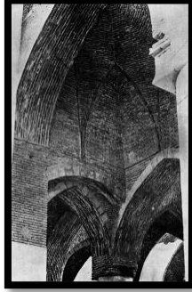
شكل (١) قبو وعقود في المسجد الجامع بأصفهان (عن بوب)

ومما يلاحظ في العمائر السلجوقية على وجه الإطلاق ما للمدخل من الضخامة وخطورة الشأن، كما تمتاز العمائر السلجوقية المختلفة بتنوع الزخارف في أبوابها تنوعاً يزيد الثروة الزخرفية ظهوراً ويكسب البناء طابعاً خاصاً كما في شكل (١).