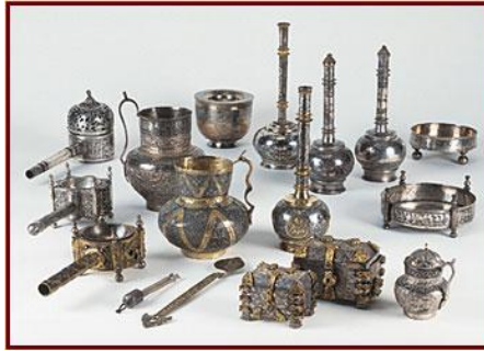
شكل رقم (٤) قناني عطر، مباخر، علب الحلي وأدوات لشرب ولجام للخيل

وفي متحف الفن الإسلامي في القدس، يعرض كنز فريد من نوعه وجميل جداً لأوعية فضية سلجوقية من القرنين ١٠ - ١١. يشمل هذا الكنز، قناني عطر، مباخر، علب الحلي وأدوات لشرب ولجام للخيل، وقد عثر على هذه الأدوات داخل زير كبير في شمال إيران، وعلى ما يبدو فإنها صنعت بعدة ورشات، وتم دفنها في قطاع خراسان شرقي إيران، هذه الأدوات مزخرفة بتقنية الحفر والتجسيم والترصيع بالمينا والتذهيب، إن ما يجعل هذه المجموعة نادرة هو كونها من معادن ثمينة وليست من البرونز أو النحاس حسب ما هو مألوف في الفن الإسلامي، وبقاؤها محفوظة في وضع جيد جداً، كما في شكل (٤).