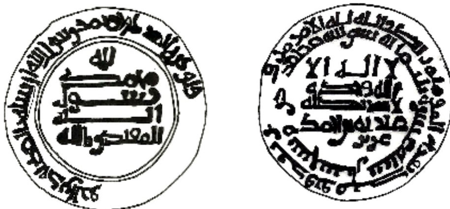
شكل (٢) رسم توضيحي للدرهم العلوي. عمل الباحث