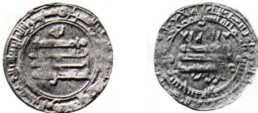
لوحة (٢) درهم عبد الله بن أحمد وولده عزيز بن أحمد ضرب سجستان سنة ٣١٠ هـ نقلا عن: Lowick : Isfahan Hoard, pl. ٩, no.351