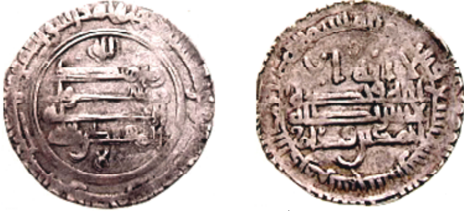
لوحة (١) درهم أحمد بن قدام ضرب سجستان سنة ٣٠٩م

٣. أبرزت الدراسة حادثة تاريخية مهمة أغفلتها معظم المصادر التاريخية، وهي ثورة عبد الله بن أحمد وولده عزيز بسجستان، وتمكنهما من الاستقلال بحكمها لمدة ستة شهور، انفرد خلالها عزيز بن عبد الله بن أحمد بحكم سجستان لمدة شهرين، ضرب فيهما النقود تأكيداً لسلطته السياسية وانفراده بحكم سجستان.