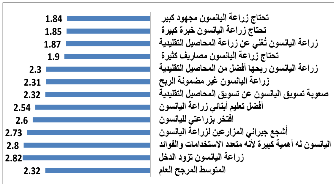
شكل 1. المتوسطات المرجحة لاتجاهات المبحوثين المتعلقة باليانسون.