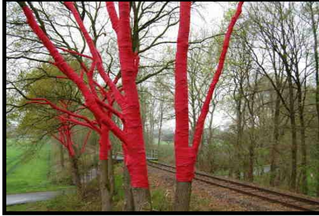
(الصورة رقم ١٣) (١) أحد من أعمال الفنان الفرنسي أدير إيه سي دو فلويتز