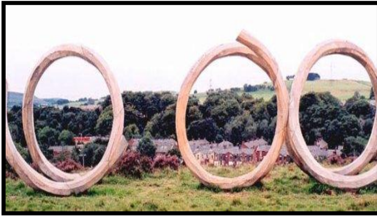
(الصورة رقم ٢١) (٢) أحد من أعمال الفنانة الإنجليزية كيث باريت