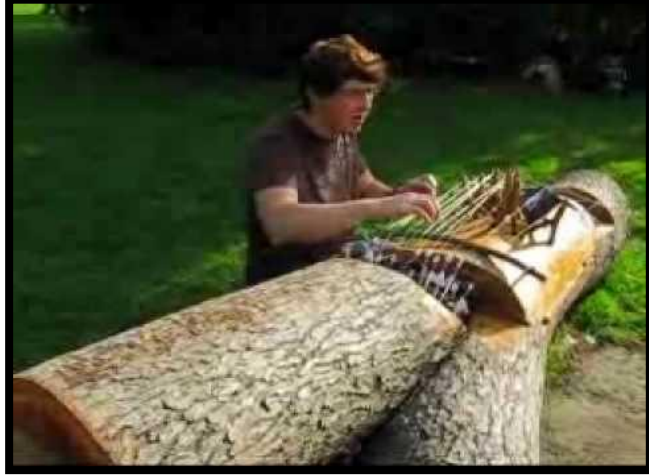
(الصورة رقم ١٧) (١) أحد أعمال الفنان الكندي أركادي فاير