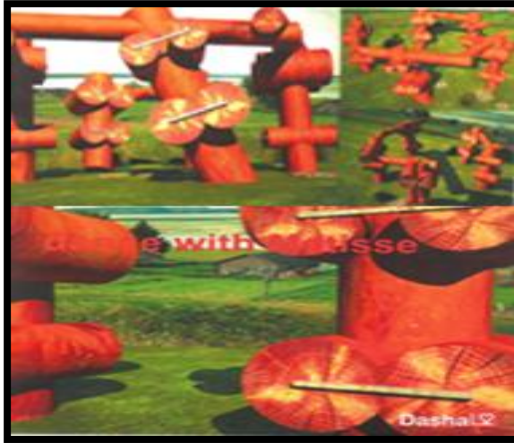
(الصورة رقم ١٨) (٢) أحد أعمال الفنان الروسي داريا ليسيتسينا