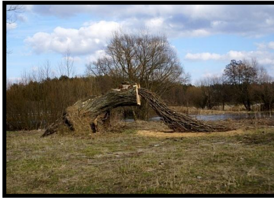
(الصورة رقم ٣) (٢) أحد من أعمال الفنان البولندي مارسن جابلونسكي