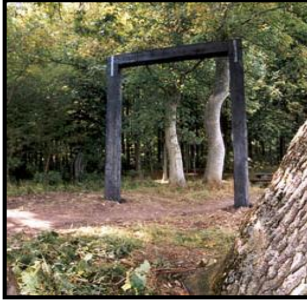
(الصورة رقم ٢٠) (١) أحد من أعمال الفنان الدنمركي مايكل هانسن