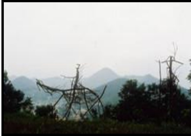
(الصورة رقم ١٤) (٢) أحد أعمال الفنان الياباني كيمورا كاتسواكي