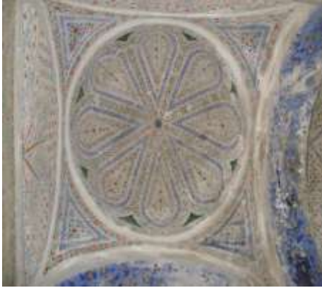
زخرفة سقف الرواق