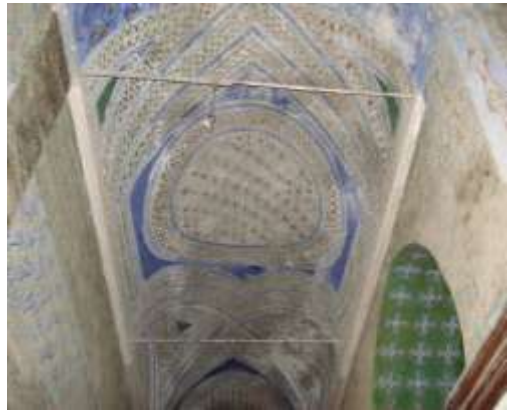
زخرفة سقف الرواق