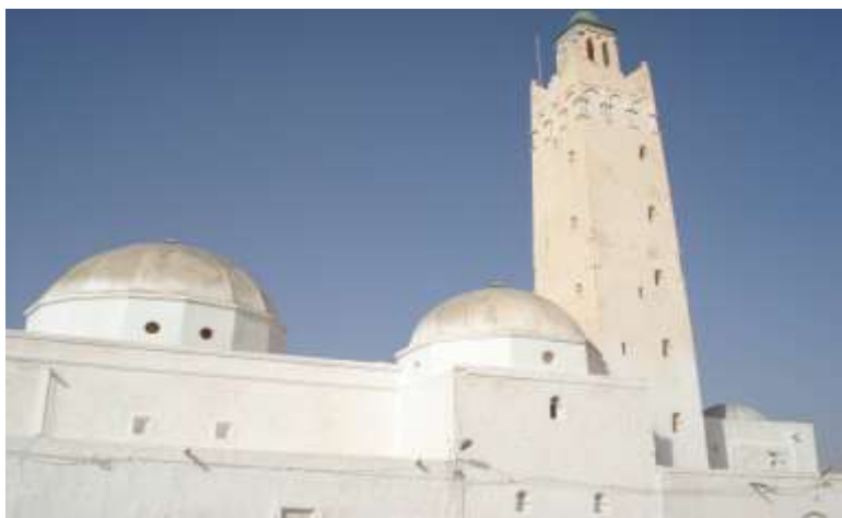
المظهر الخارجي لمبنى الضريح