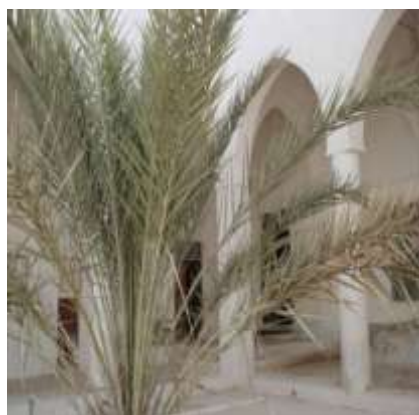
صحن مبنى الضريح