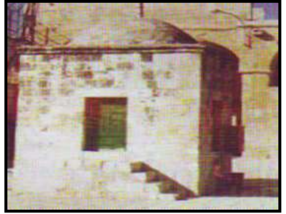
سبيل باب المغاربة ( شكل ٩ )