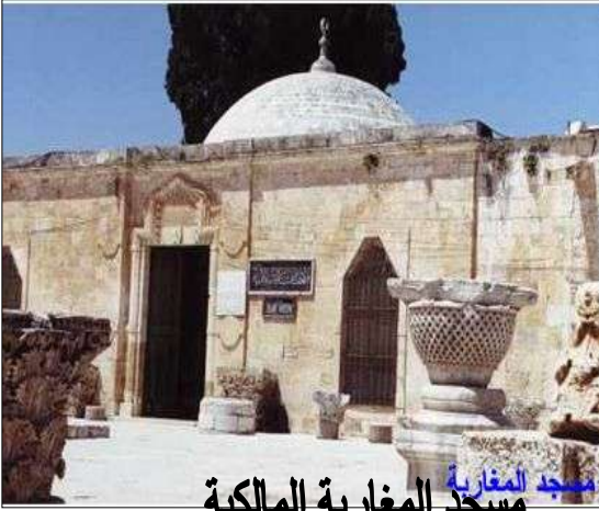
مسجد المغاربة المالكية