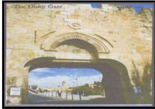
باب المغاربة الخارجي ويسم باب سلوان وباب الباغه (شكل ٣)