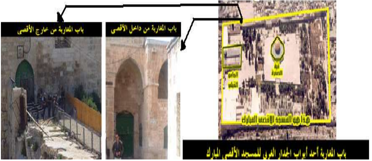
الوصف المعماري للبوابه ( شكل ٤ )