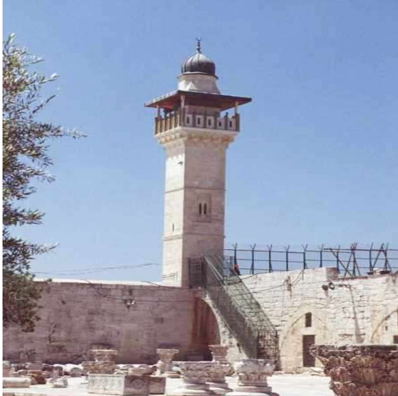
منذنة مسجد المغاربة